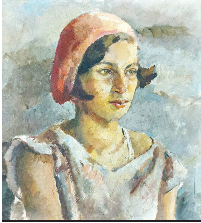
А.Ф. ВАСИЛЬЕВА. «ПОРТРЕТ ДЕВУШКИ». 1926 ГОД.

Среди многочисленных женских портретов в фондах музея есть ряд произведений, посвященных женщинам – Героям Советского Союза, на судьбу которых выпала война.