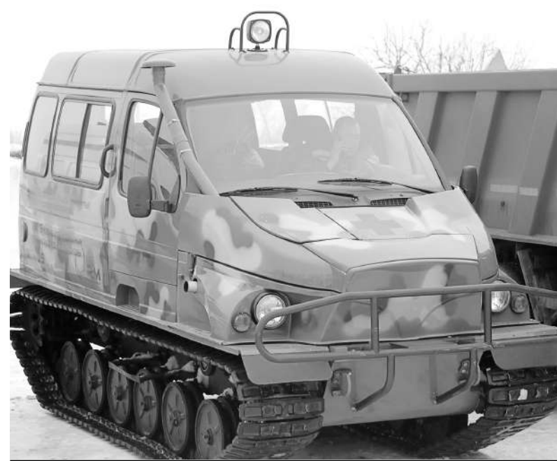
БЛИЗ СЕЛА САДОВОГО БУХАР-ЖЫРАУСКОГО РАЙОНА СОСТОЯЛСЯ СМОТР СПЕЦИАЛЬНОЙ ТЕХНИКИ, СИЛ И СРЕДСТВ, КОТОРЫМИ ПОЛЬЗУЮТСЯ СОТРУДНИКИ ДЕПАРТАМЕНТА ПО ЧС КАРАГАНДИНСКОЙ ОБЛАСТИ.