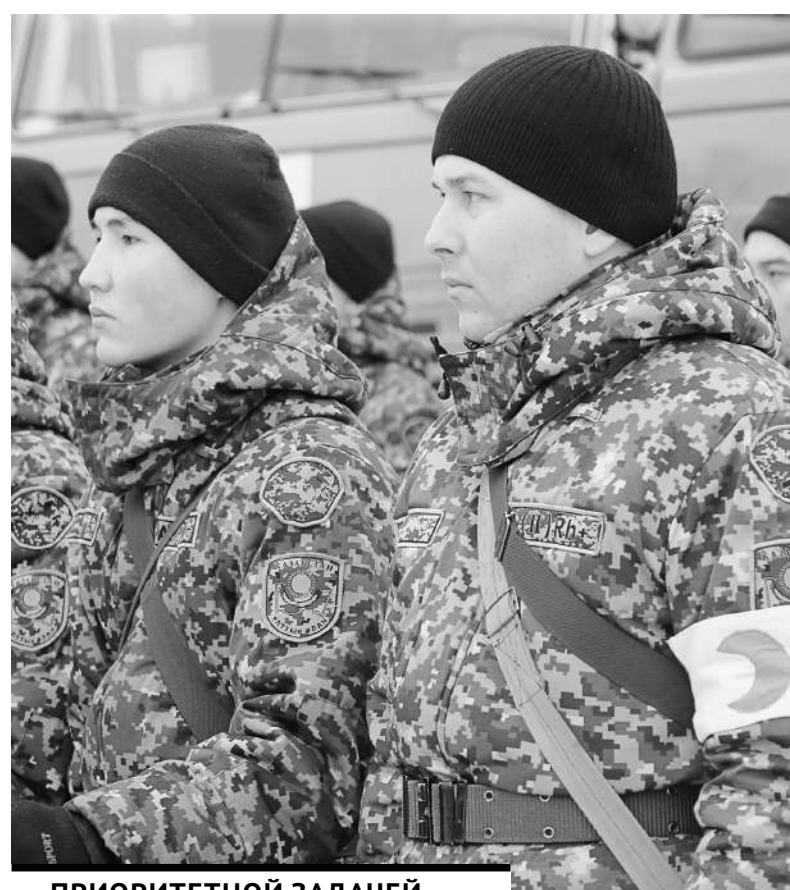
ПРИОРИТЕТНОЙ ЗАДАЧЕЙ ЯВЛЯЕТСЯ СПАСЕНИЕ ГРАЖДАНСКОГО НАСЕЛЕНИЯ.