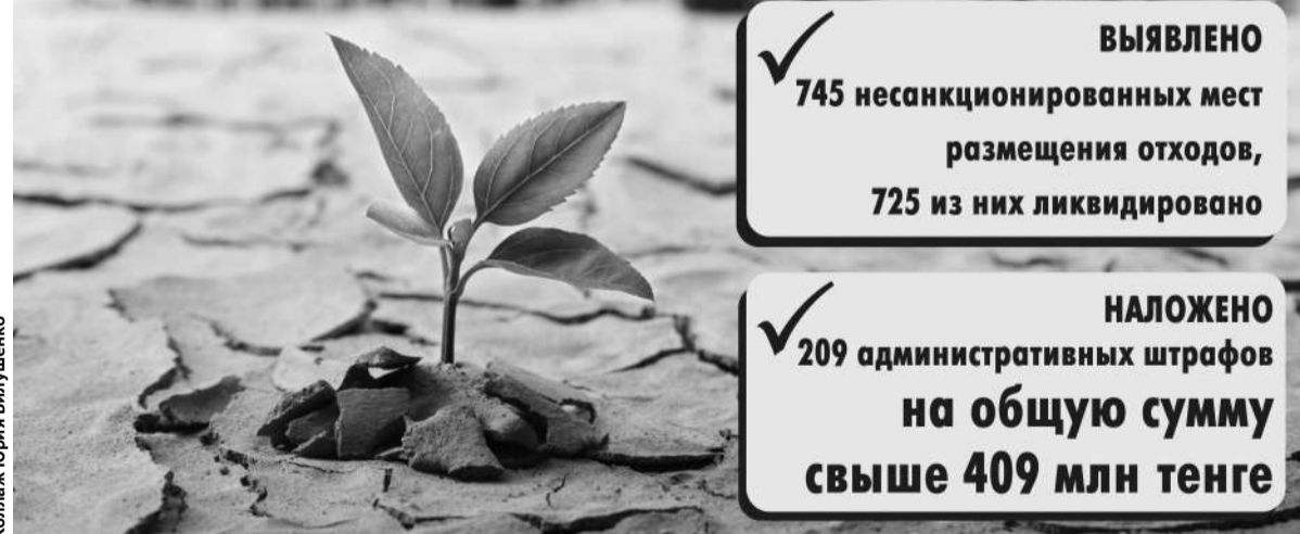
Коллаж Юрия Быгушенко

✓ НАЛОЖЕНО 209 административных штрафов на общую сумму свыше 409 млн тенге