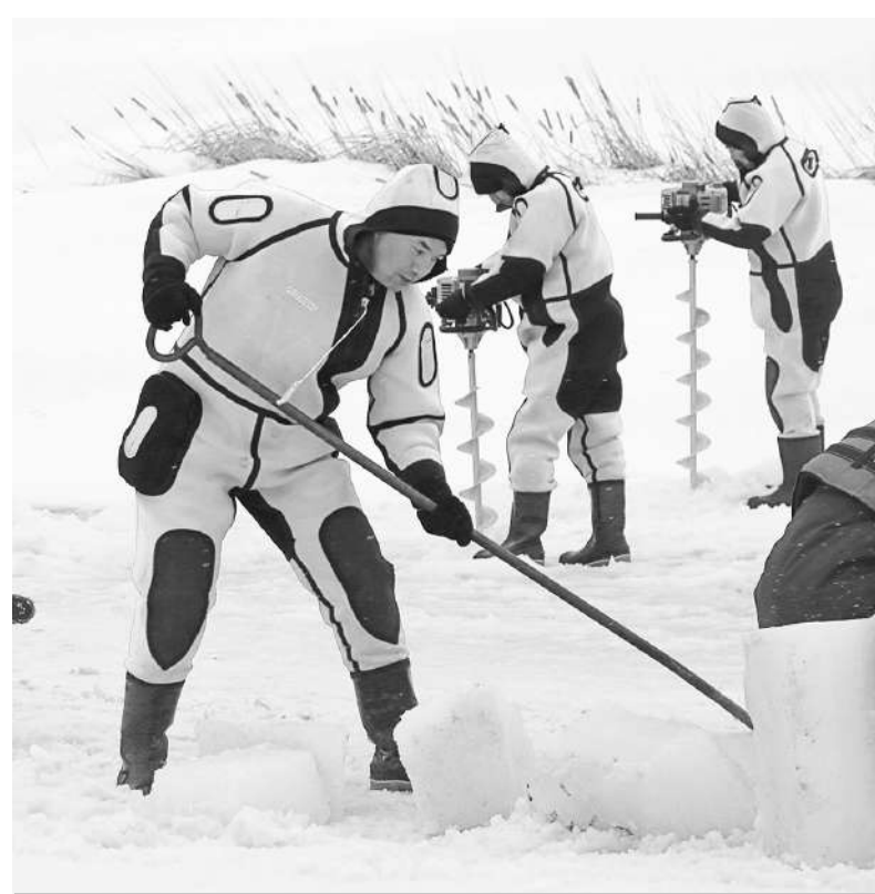
– МЕСТНЫЕ ИСПОЛНИТЕЛЬНЫЕ ОРГАНЫ ЗАРАНЕЕ ПОДГОТОВИЛИ МЕСТА ДЛЯ ВЫВОЗА СНЕГА, ВО ВРЕМЯ УЧЕНИЙ ОЧИЩАЮТСЯ ДРЕНАЖНЫЕ ВОДОПРОПУСКНЫЕ СООРУЖЕНИЯ, ПОДГОТОВЛИВАЮТСЯ ИНЕРТНЫЕ МАТЕРИАЛЫ.

Всего в командно-штабных учениях «Көктем-2023» в Карагандинской области были задействованы более 3 тысяч человек личного состава, 1388