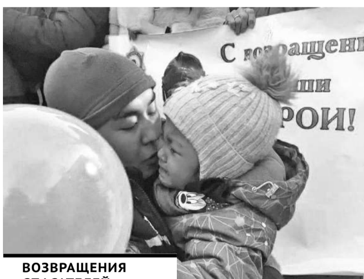
ВОЗВРАЩЕНИЯ СПАСАТЕЛЕЙ С ВОЛНЕНИЕМ И НЕТЕРПЕНИЕМ ЖДАЛИ РОДНЫЕ, ДРУЗЬЯ И КОЛЛЕГИ.

мок с вещами и другими предметами первой необходимости собрали и представители КГУ «Молодежный ресурсный центр города Караганды».