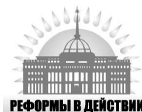
РЕФОРМЫ В ДЕЙСТВИИ

Реформы – это перезагрузка всей нашей политической системы. Они позволяют сосредоточиться на решении долгосрочных задач по обеспечению устойчивого экономического роста, повышению благосостояния и качества жизни нашего населения.