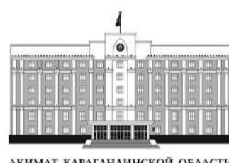
АКИМ КАРАГАНДИНСКОЙ ОБЛАСТИ

зации предупреждения и ликвидации аварий и стихийных бедствий Карагандинской области.