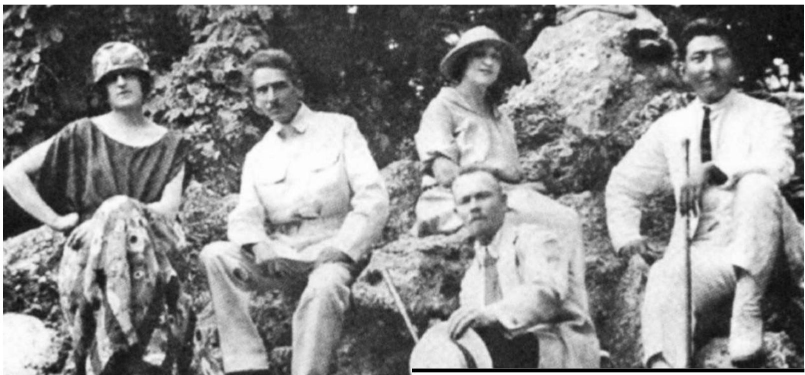
ЖАХАНША ДОСМУХАМЕДОВ (СПРАВА) С СУПРУГОЙ ВО ВРЕМЯ ОТДЫХА В КРЫМУ.

Внезапно в условиях того времени алашординцы проявляли исключительную гибкость, в то же время они были принципиальными политиками. Основными целями движения «Алаш» являлись создание системы государственного самоуправления, отстаивание пра-