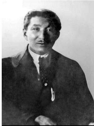
ЖАХАНША ДОСМУХАМЕДОВ, 1920 ГОД.