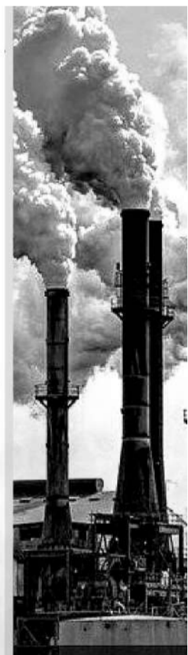
Коллаж: Наталья Романовской

– За прошлый год на территории Карагандинской области было выявлено 745 несанкционированных свалок. На наш взгляд, предлагаемые системные меры позволят реализовать поручения Главы государства и создать централизованную систему управления ТБО. Все это поможет решить проблему с полигонами, которые, к сожалению, на сегодня в плачевном состоянии, – констатировал спикер.