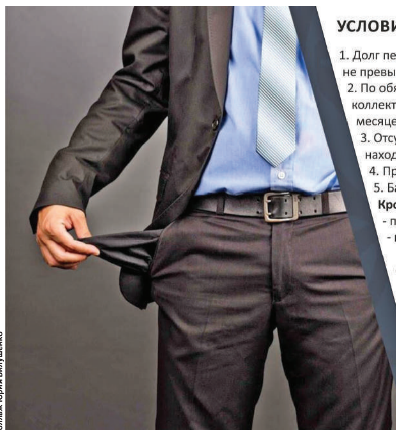
Коллаж Юрия Былушенко

Внесудебное банкротство применяют только по долгам перед банками, МФО и коллекторскими агентствами. Эта процедура возможна при определенных условиях. К примеру, если задолженность не превышает 5,5 миллиона тенге, а погашения не было в течение 12 месяцев. Сюда же относится отсутствие зарегистрированного имущества. Также перед процедурой заемщик