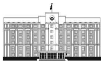
АКИМАТ КАРАГАНДИНСКОЙ ОБЛАСТИ