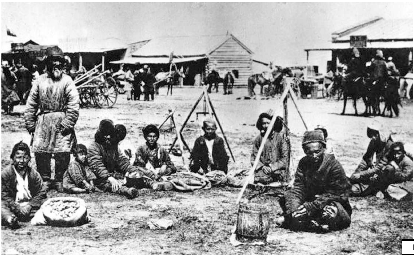
НА КОЯНДИНСКОЙ ЯРМАРКЕ.