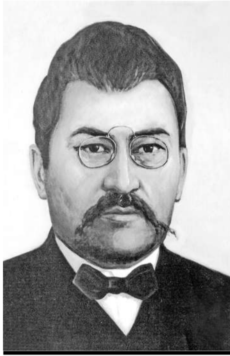
АХМЕТ БАЙТУРСЫНОВ, 1872-1937 ГОДЫ.

Начало XX века ознаменовалось активным включением казахской интеллигенции в политическую жизнь Российской империи. Особую роль в этом процессе сыграла первая русская революция 1905-1907 годов, которая побудила национальную интеллигенцию определить свою позицию, свое отношение к происходящим событиям. Именно в этот период оформилось политическое движение «Алаш», активным участником которого стал Ахмет Байтұрсынов.