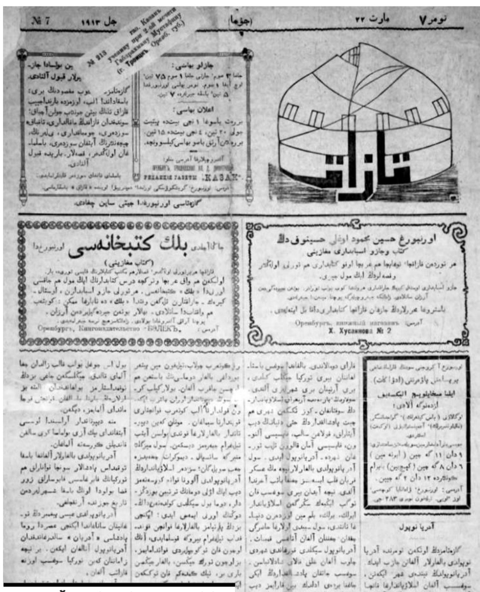
А. БАЙТУРСЫНОВУ УДАЛОСЬ СПЛОТИТЬ ВОКРУГ ГАЗЕТЫ «КАЗАХ» ВИДНЫХ КАЗАХСКИХ ПИСАТЕЛЕЙ И ПОЭТОВ.

ропейской части России форсированными темпами шла колонизациязиатского Востока России. Общеизвестно, что в результате крестьянской и казачьей колонизации к 1916 году казахи лишились 40 млн гектаров земель и были вытеснены в бесплодную степь и горы. Особенно открытым и хищническим стало ограбление Степного края в годы первой мировой войны. Из степи в огромном количестве по принудительным ценам вы-