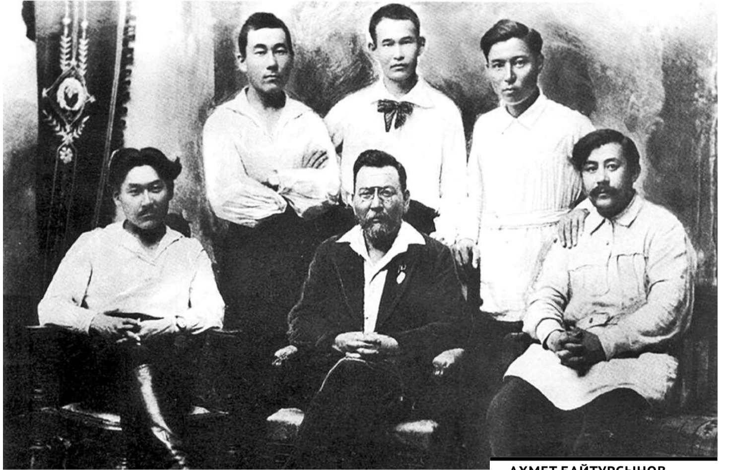
АХМЕТ БАЙТУРСЫНОВ (ПЕРВЫЙ РЯД ПОСЕРЕДИНЕ), 1922 ГОД.

В 1913 году, рассуждая о состоянии казахского народа, он писал: «Само существование казахской нации стало острой проблемой». Объяснялось это общим состоянием казахской степи и политикой царской России, проводимой в казахском крае. В начале XX века в результате интенсивного переселения крестьян из ев-