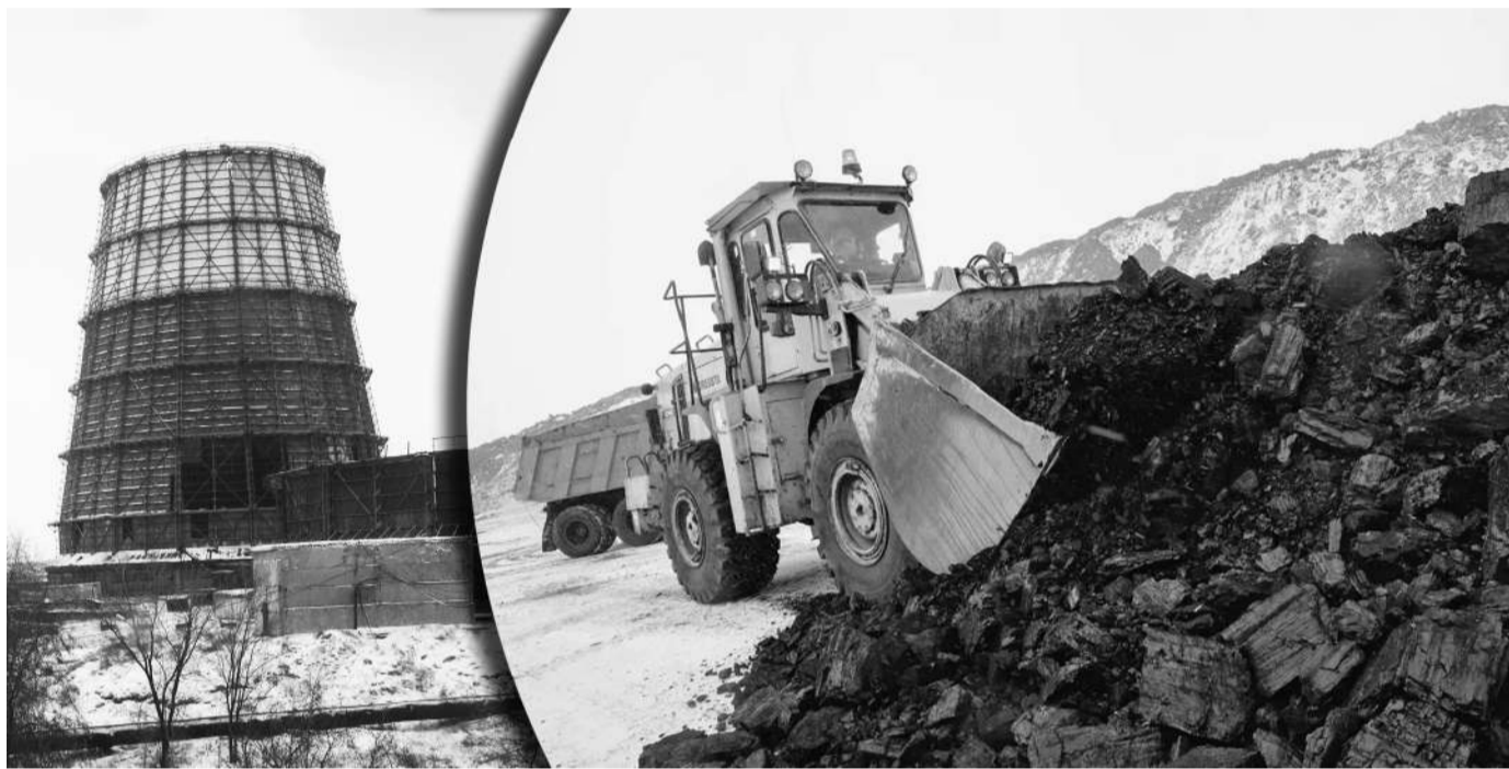
Комплекс Юрия Вилушенко

На днях Премьер-министр РК Аликан Смаилов на заседании Правительства отметил проблему запасов топлива на теплоэлектроцентралях. Это стало известно после того, как в Казахстане завершила работу выездная комиссия.