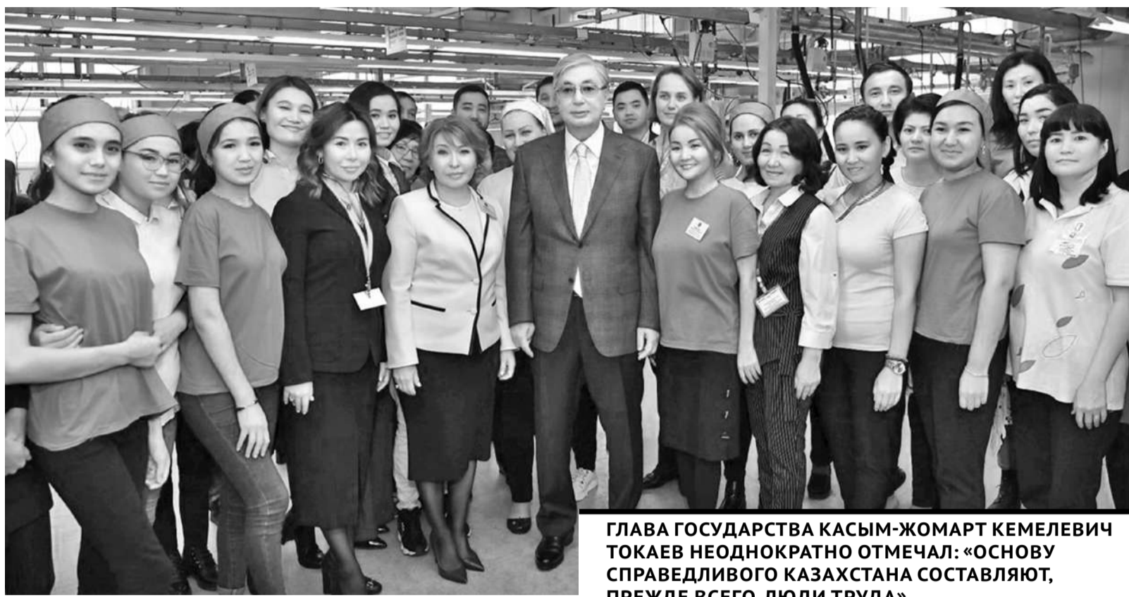
ГЛАВА ГОСУДАРСТВА КАСЫМ-ЖОМАРТ КЕМЕЛЕВИЧ ТОКАЕВ НЕОДНОКРАТНО ОТМЕЧАЛ: «ОСНОВУ СПРАВЕДЛИВОГО КАЗАХСТАНА СОСТАВЛЯЮТ, ПРЕЖДЕ ВСЕГО, ЛЮДИ ТРУДА».

Первое подразделение из группы компаний, ТОО «Производственная инновационная компания «Ютария ltd», было создано