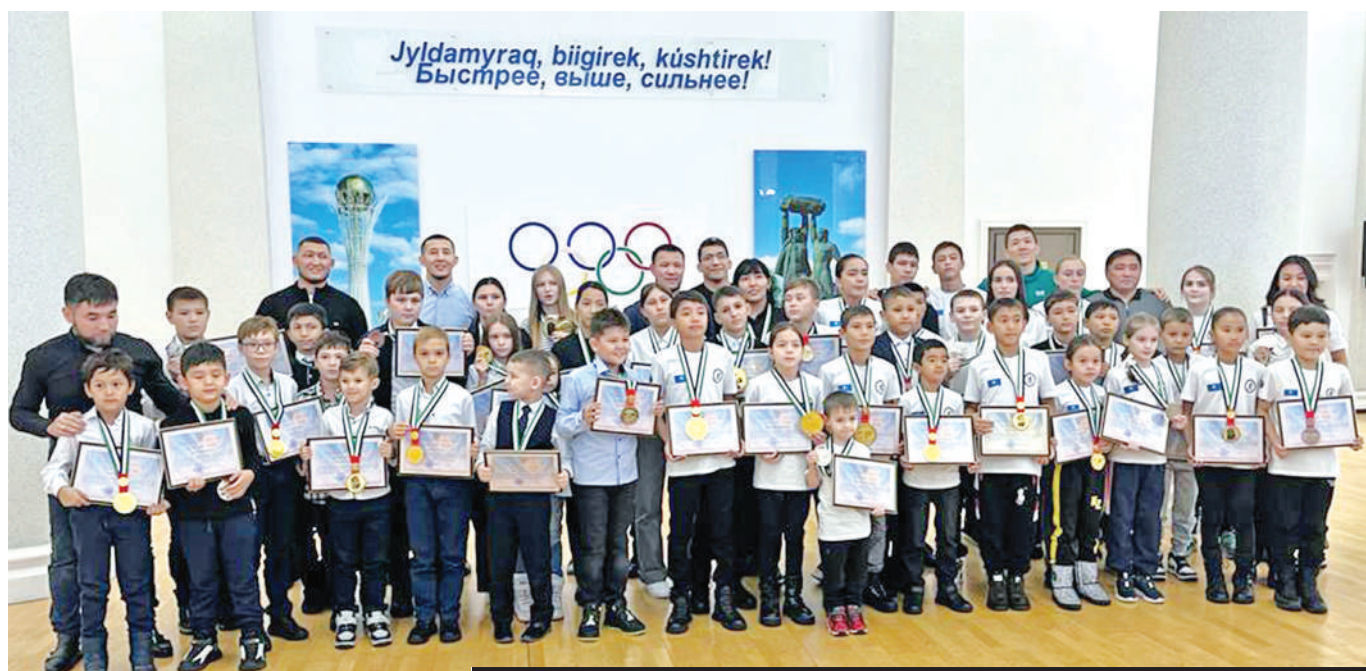
КАЗАХСТАНСКАЯ ЮНОШЕСКАЯ СБОРНАЯ СУМЕЛА ЗАНЯТЬ ПЕРВОЕ ОБЩЕКОМАНДНОЕ МЕСТО.

Рекордное количество медалей завоевали карагандинские спортсмены на открытом чемпионате мира по бразильскому джиу-джитсу в ОАЭ. Нескольким мастерам удалось защитить черный пояс.