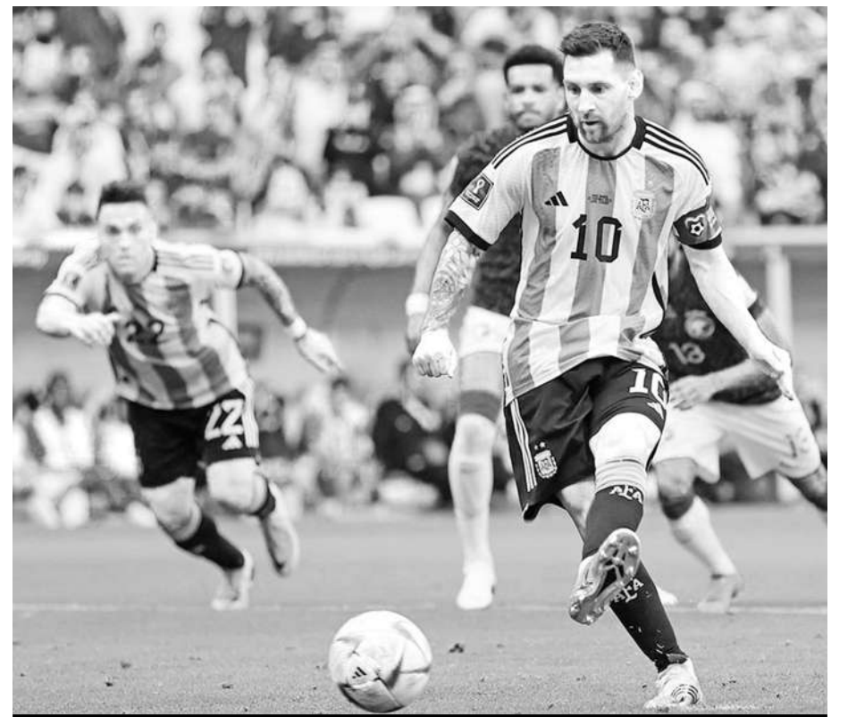
БОЛЬШЕ ВСЕГО ВПЕЧАТЛЕНИЙ У БОЛЕЛЬЩИКОВ ОСТАЛОСЬ ОТ ПРОТИВОСТОЯНИЯ КОМАНД АРГЕНТИНЫ И САУДОВСКОЙ АРАВИИ. ЯВНЫЙ ФАВОРИТ НАДЕЯЛСЯ НА БЫСТРУЮ ПОБЕДУ, НО ЧТО-ТО ПОШЛО НЕ ТАК.

Встреча Мексики и Польши тоже особо ничем не отличилась. На 58-й минуте матча арбитры назначили пенальти в ворота мексиканцев, но Роберт Леван-