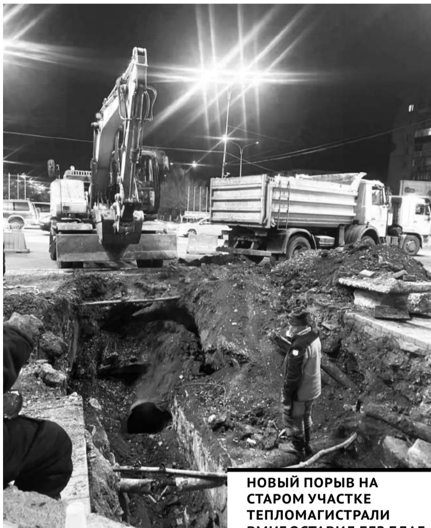
НОВЫЙ ПОРЫВ НА СТАРОМ УЧАСТКЕ ТЕПЛОМАГИСТРАЛИ ВМИГ ОСТАВИЛ БЕЗ БЛАГ ЦИВИЛИЗАЦИИ ЖИЛЬЦОВ 58 МНОГОЭТАЖНЫХ ДОМОВ.