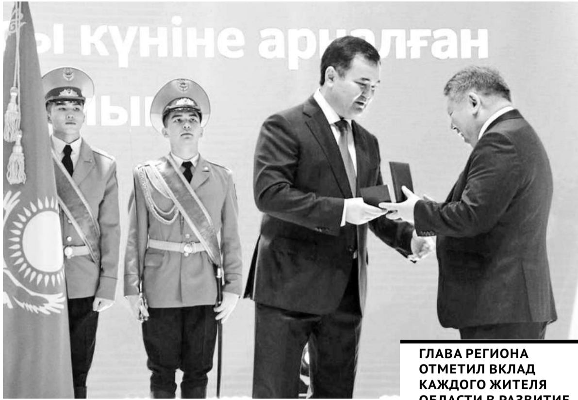
ГЛАВА РЕГИОНА ОТМЕТИЛ ВКЛАД КАЖДОГО ЖИТЕЛЯ ОБЛАСТИ В РАЗВИТИЕ И ПРОЦВЕТАНИЕ НАШЕЙ СТРАНЫ.

– Одна из особенностей нашей области – ее полиэтничность. Как отметил Глава государства во время своего визита в наш регион, десятки этносов живут вместе на благодатной земле Сарыарки, воплощая в жизнь главный принцип нашего общества – единство нации в ее многообразии, – подчеркнул аким области, отметив деятельность областной Ассамблеи народа Казахстана, руководителей этнокультурных