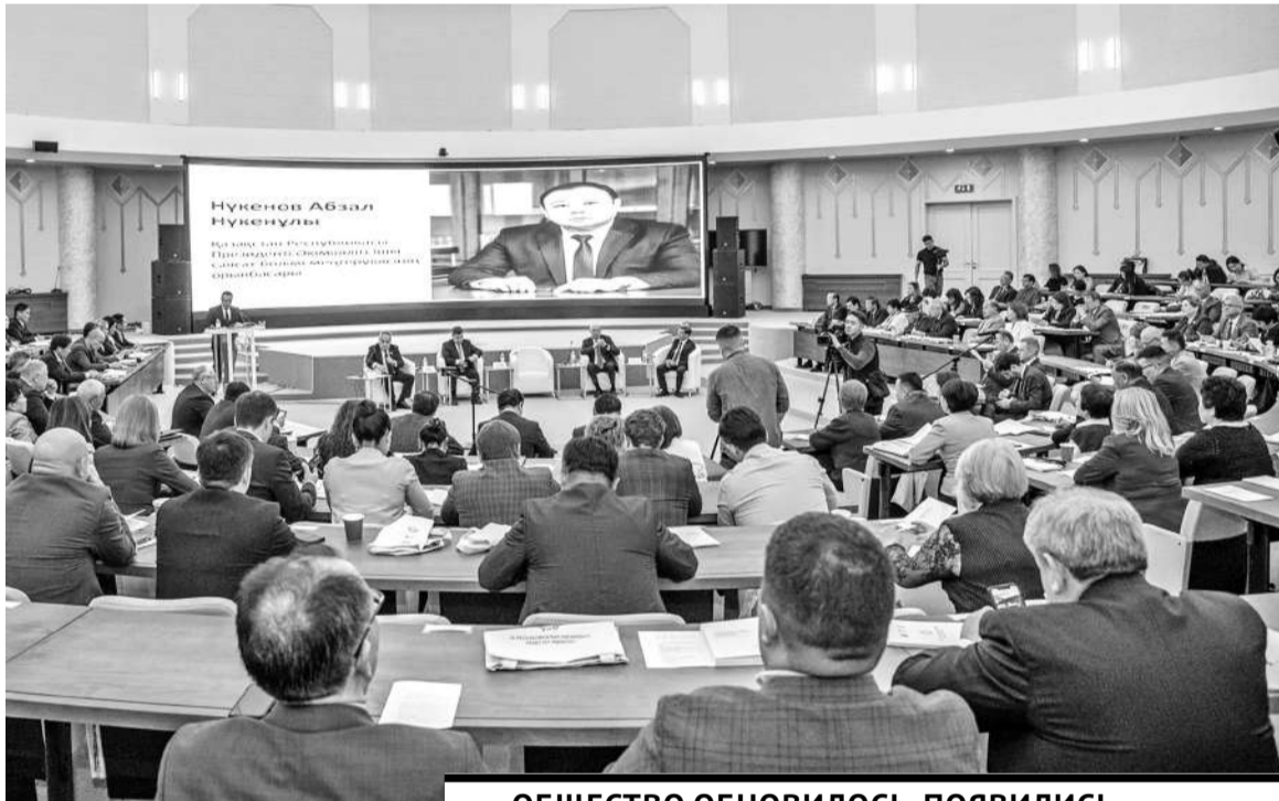
– ОБЩЕСТВО ОБНОВИЛОСЬ, ПОЯВИЛИСЬ НОВЫЕ ЦЕЛИ И ЗАДАЧИ, И МЫ ДОЛЖНЫ ИМ СООТВЕТСТВОВАТЬ. ОБЩЕСТВЕННЫЕ СОВЕТЫ СЛУЖАТ МОСТОМ МЕЖДУ ОБЩЕСТВОМ И ГОСУДАРСТВОМ.

Как известно, в своем Послании народу Казахстана Глава государства поручил обратить самое пристальное внимание на вопросы реформирования деятельности консультативно-совещательных органов. В чем именно будет заключаться эта перезагрузка, нацеленная на повышение эффективности работы гражданских активистов, обсудили делегаты со всех регионов республики, в том числе из Карагандинской области.