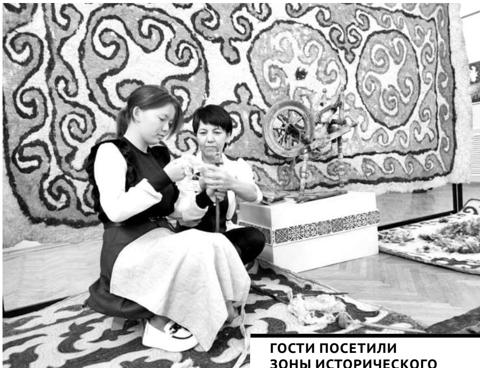
ГОСТИ ПОСЕТИЛИ ЗОНЫ ИСТОРИЧЕСКОГО ПОГРУЖЕНИЯ, В КОТОРЫХ СМОГЛИ В ИНТЕРАКТИВНОЙ ФОРМЕ ОЗНАКОМИТЬСЯ С НАРОДНЫМИ РЕМЕСЛАМИ.

Фрагмент зимовки Жауыр-откель в урочище Жауыртау, которая в XIX - начале XX века располагалась на территории нынешнего Самаркандского водохранилища, воссоздали в Темиртауском городском историко-краеведческом музее. За основу были взяты документальные материалы научных экспедиций.