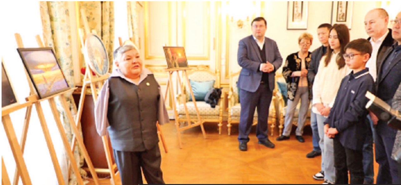
С 22 ПО 30 СЕНТЯБРЯ ПРОШЛИ ПЯТЬ ВЫСТАВОК - В СОВЕТЕ ЕВРОПЫ И УНИВЕРСИТЕТЕ ГОРОДА СТРАСБУРГА, ПОСОЛЬСТВЕ РК И ЛЮКСЕМБУРГСКОМ ДВОРЦЕ (СЕНАТЕ) В ПАРИЖЕ, А ТАКЖЕ ДОМЕ АССОЦИАЦИЙ В РЕННЕ.