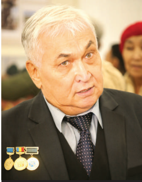
- ГЛАВНАЯ ЗАДАЧА ХУДОЖНИКА - УЛУЧШИТЬ НАШ МИР ЧЕРЕЗ КРАСОТУ.

Как отмечают музейщики, наиболее органичен Ж. Комутов в графике. Его работы, выполненные тушью или гелевой ручкой, небольшие, но каждая заставляет