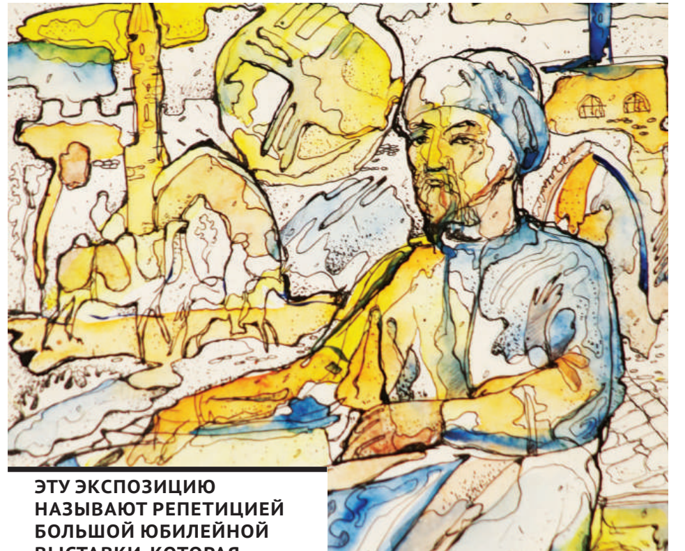
ЭТУ ЭКСПОЗИЦИЮ НАЗЫВАЮТ РЕПЕТИЦИЕЙ БОЛЬШОЙ ЮБИЛЕЙНОЙ ВЫСТАВКИ, КОТОРАЯ СОСТОИТСЯ ЧЕРЕЗ ДВА ГОДА.

дожника. Примечательно, что его мысли живут не только на бумаге. По большому счету, это эскизы для сувениров и малых архитектурных форм, воплощенные в проектах «Реплика на артефакты Казахстана», «Добродетели казахского народа» и др. Достаточно вспомнить композицию «Гашыктар», которая украшает одну из центральных улиц Караганды. И мало кто знает, что «Алакай», «Жас жырау», «Болашақ», на фоне которых любят фотографироваться жители и гости города Абая и поселка Ботакара, - его рук дело.