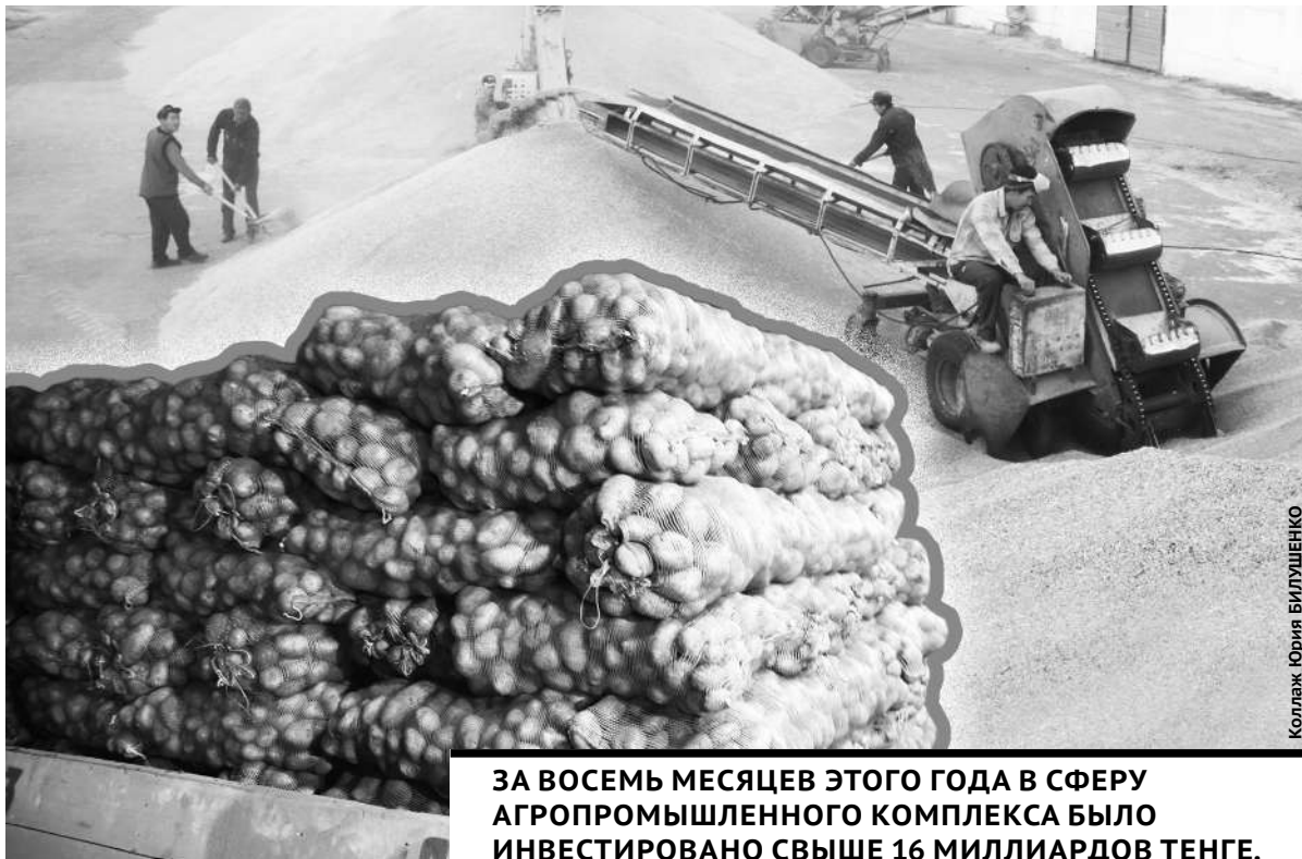
Коллаж Юрия БИЛУШЕНКО

ЗА ВОСЕМЬ МЕСЯЦЕВ ЭТОГО ГОДА В СФЕРУ АГРОПРОМЫШЛЕННОГО КОМПЛЕКСА БЫЛО ИНВЕСТИРОВАНО СЫШЕ 16 МИЛЛИАРДОВ ТЕНГЕ.