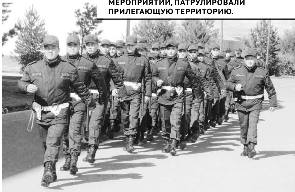
ГВАРДЕЙЦЫ ОБЕСПЕЧИВАЛИ БЕЗОПАСНОСТЬ ПЕРЕДВИЖЕНИЯ ОХРАНЯЕМЫХ ЛИЦ, ОЦЕПЛЯЛИ МЕСТА ПРОВЕДЕНИЯ МЕРОПРИЯТИЙ, ПАТРУЛИРОВАЛИ ПРИЛЕГАЮЩУЮ ТЕРРИТОРИЮ.

- В связи с прибытием в столицу большого количества гостей со всего мира в общественных местах, на улицах, а также в местах проведения культурно-массовых мероприятий приняты дополнительные меры безопасности. Так, например, в мессе с участием Папы Римского Франциска приняло участие более 3 тысяч человек. Для обеспечения общественного порядка прибыл личный состав воинских частей 5510 из Костаная и Карагандинского полка Национальной гвардии (в/ч 5451). У военнослужащих уже имеется опыт подобных командировок в столицу во время проведения международных выставок, а также других крупных культурных и спортивных мероприятий, - говорит первый заместитель командующего РГК «Орталык», начальник штаба, полковник Нурбол Миртаев.