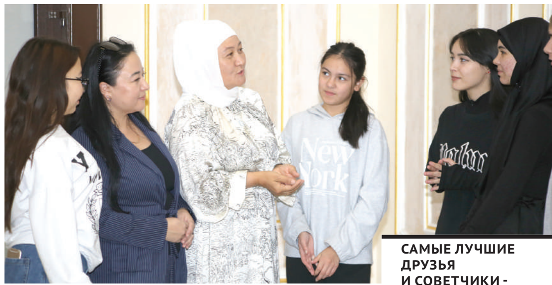
САМЫЕ ЛУЧШИЕ ДРУЗЬЯ И СОВЕТЧИКИ - ЭТО РОДИТЕЛИ.