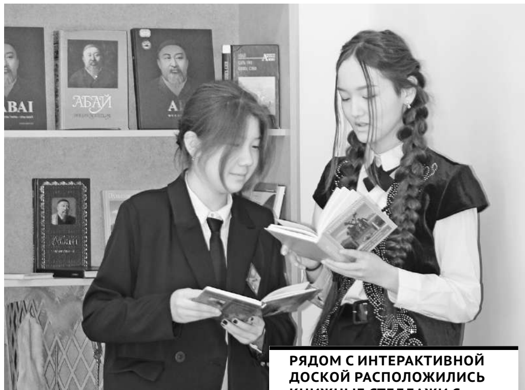
РЯДОМ С ИНТЕРАКТИВНОЙ ДОСКОЙ РАСПОЛОЖИЛИСЬ КНИЖНЫЕ СТЕЛЛАЖИ С ПРОИЗВЕДЕНИЯМИ АБАЯ.

Абай называл науку, образование и просвещение универсальными средствами для решения всех проблем человечества. Опираясь на его постулаты, в одной из школ Сарани открыли для своих учеников кабинет абаеведения.