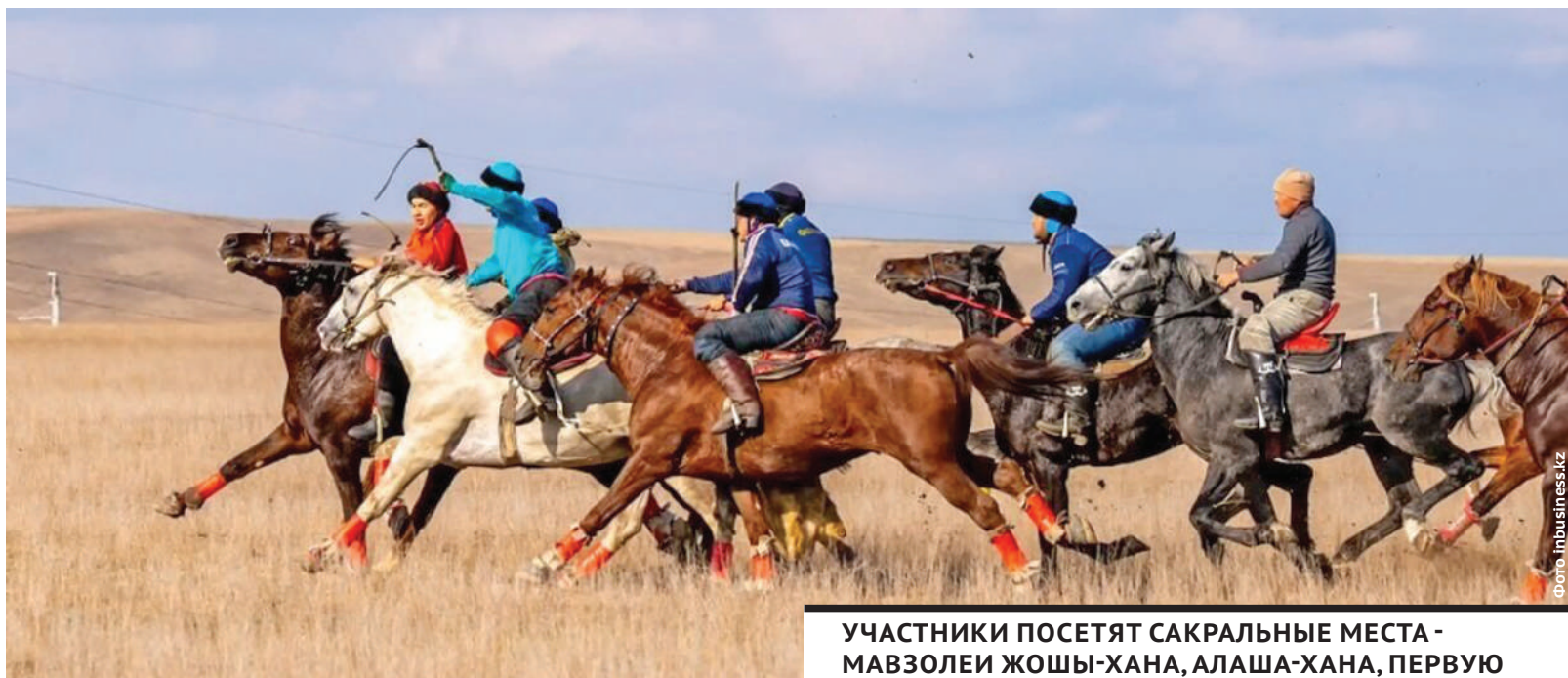
УЧАСТНИКИ ПОСЕТЯТ САКРАЛЬНЫЕ МЕСТА - МАВЗОЛЕИ ЖОШЫ-ХАНА, АЛАША-ХАНА, ПЕРВУЮ СТОЛИЦУ КАЗАХСКОГО ХАНСТВА - СОЗАК, КОЛЫБЕЛЬ ТЮРКСКОЙ ДУХОВНОСТИ, «ГОРОД ДВУХ МИРОВ» ТУРКЕСТАН И МАВЗОЛЕЙ АЗРЕТ-СУЛТАН.