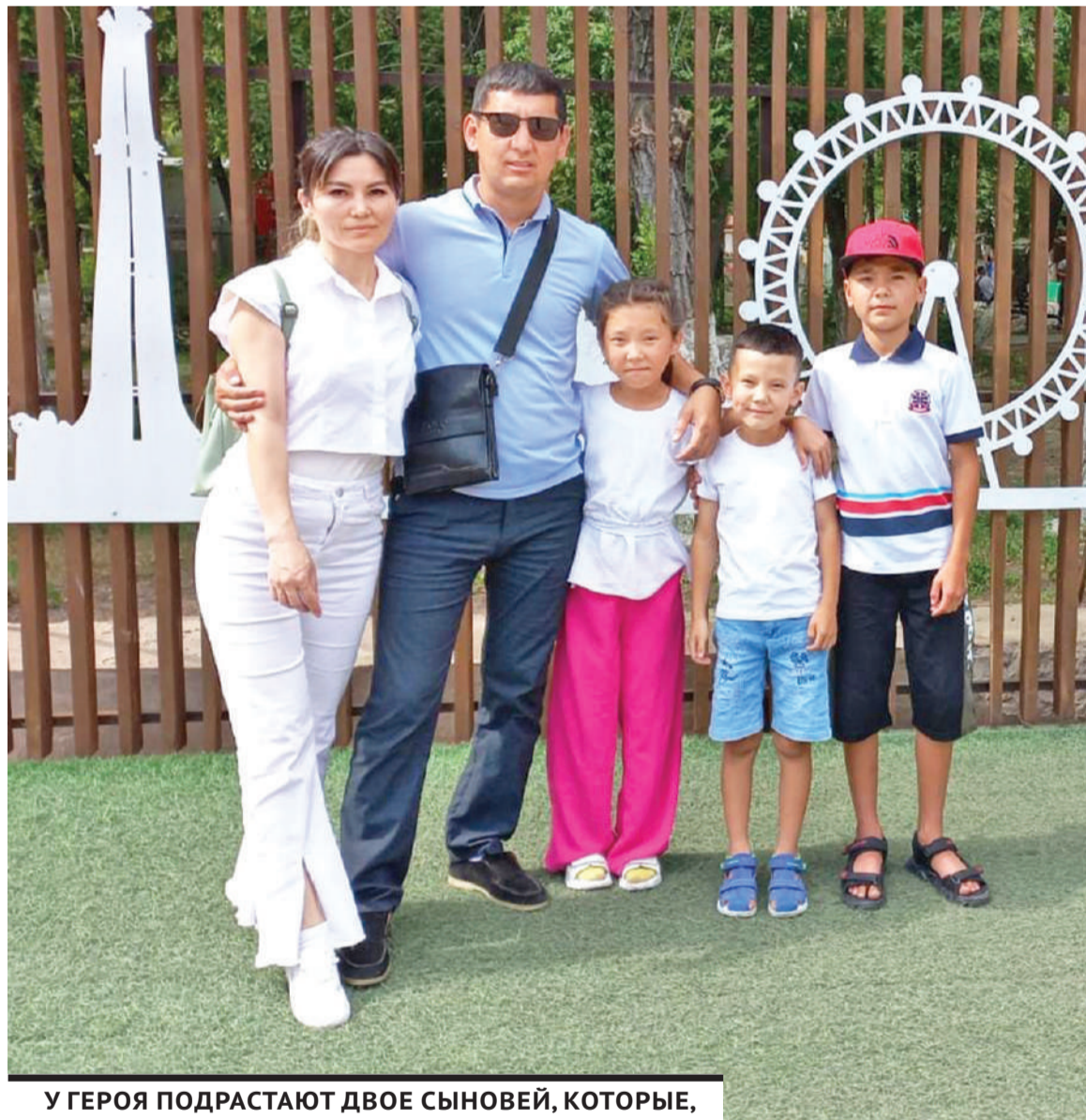
У ГЕРОЯ ПОДРАСТАЮТ ДВОЕ СЫНОВЕЙ, КОТОРЫЕ, КАК И ВСЕ МУЖЧИНЫ СЕМЬИ, НАМЕРЕНЫ СЛУЖИТЬ В ПРАВООХРАНИТЕЛЬНЫХ ОРГАНАХ И ПОМОГАТЬ ЛЮДЯМ.

женщина отдыхала со своей подругой на водоеме. Они заплыли далеко, и одна из них, не рассчитав силы, начала тонуть. Оказывалась в том месте есть водоворот.