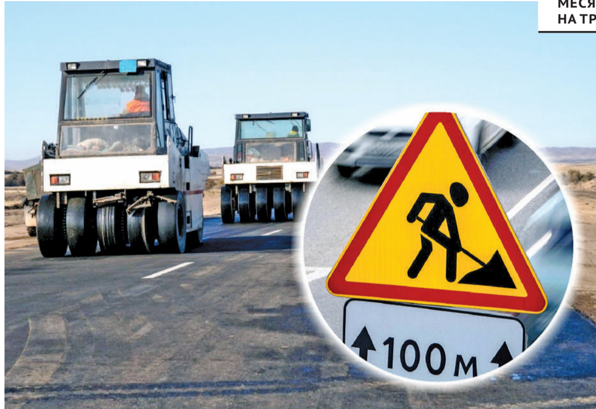
Коллаж Натальи Романовской

- Сейчас есть два основных оператора, которые следят за состоянием дорог в стране и оказывают услуги. Если говорить о том, что они оба выполняют одну и ту же работу, то количество работников также превышает необходимую величину. Тем не менее число обоснованных жалоб от граждан не уменьшается, а качество дорог вообще не выдерживает критики. Поручаю Правительству объединить «КазАвтоЖол» и «Казахавтордор» и создать единую