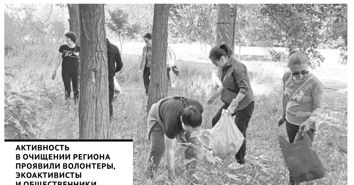
АКТИВНОСТЬ В ОЧИЩЕНИИ РЕГИОНА ПРОЯВИЛИ ВОЛОНТЕРЫ, ЭКОАКТИВИСТЫ И ОБЩЕСТВЕННИКИ.

В уборке приняли участие свыше 33 тысяч человек, было задействовано 200 единиц техники, ликвидировано 189 свалок близ населенных пунктов. Участники акции также очистили рекреационные зоны, парки и аллеи городов. Жители массово вышли и на уборку дворов и территории своих организаций. Активность в очищении региона проявили волонтеры, экоактивисты и общественники.