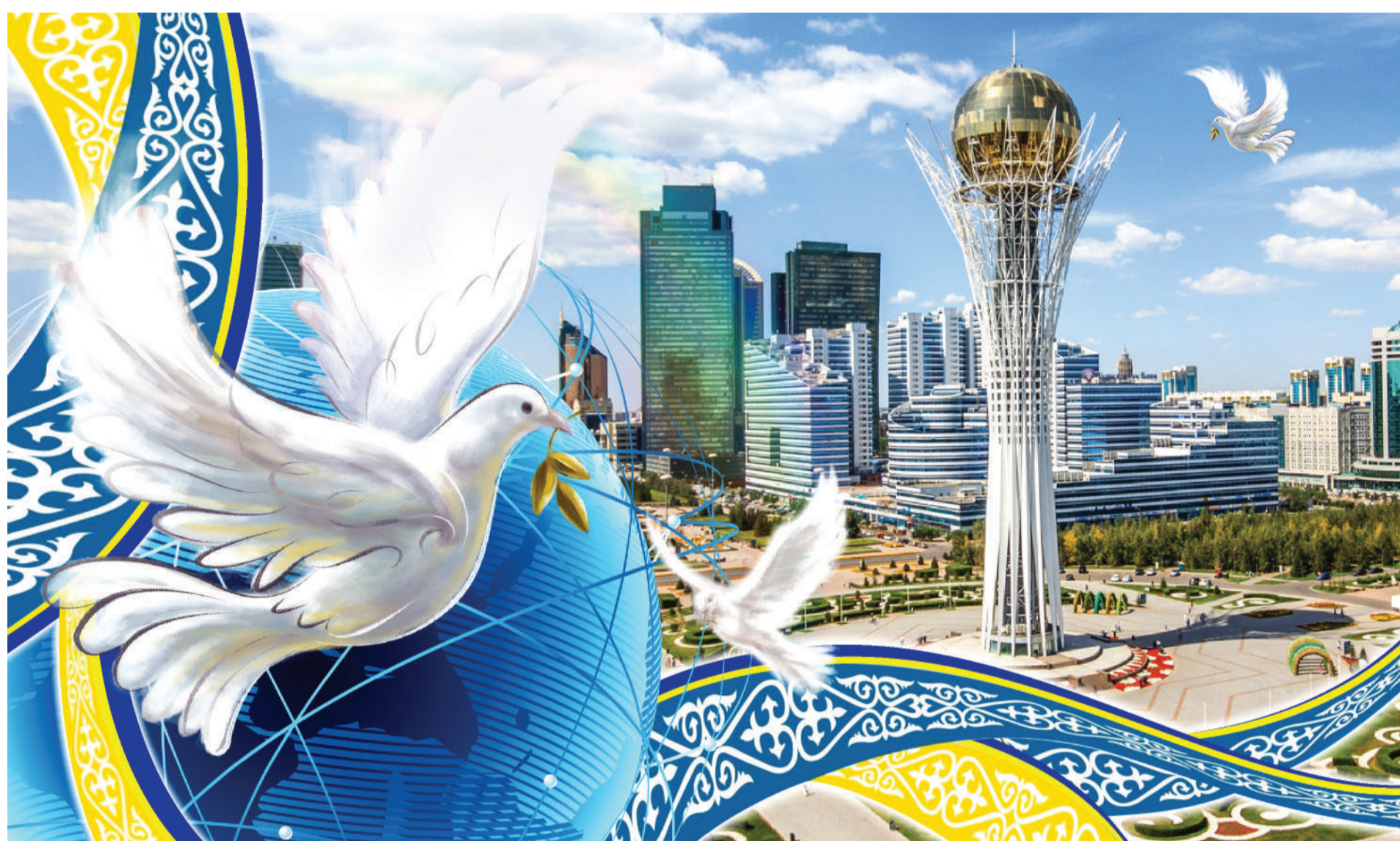
Коллаж Натальи Романовской