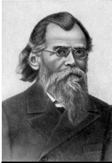
Г. Н. ПОТАНИН.

У Григория Николаевича Потанина был свой особый взгляд ученого-этнографа на окружающие его прибалхашские племена. Сказки сказками, но чем еще может быть интересен для исследователя этот народ? И он странствует по аулам, заходит в юрты, фиксируя все особенности и тонкости бытовой жизни. Скоро наблюдения дают основание говорить о наличии такой высококоразвитой отрасли домашнего искусства, как художественная орнаментика. В своем дневнике Потанин записывает: