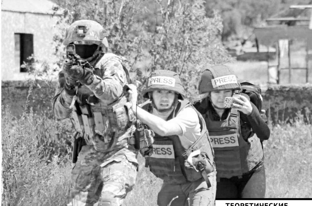
ТЕОРЕТИЧЕСКИЕ ЗНАНИЯ УЧАСТНИКИ СЕМИНАРА ЗАКРЕПИЛИ НА БАЗЕ УЧЕБНОГО ЦЕНТРА, В ПОЛЕ.

На полигоне регионального командования «Астана» прошел учебно-практический семинар «Военный дискурс. Спасск-2022», организованный для журналистов республиканских и региональных СМИ, а также блогеров.