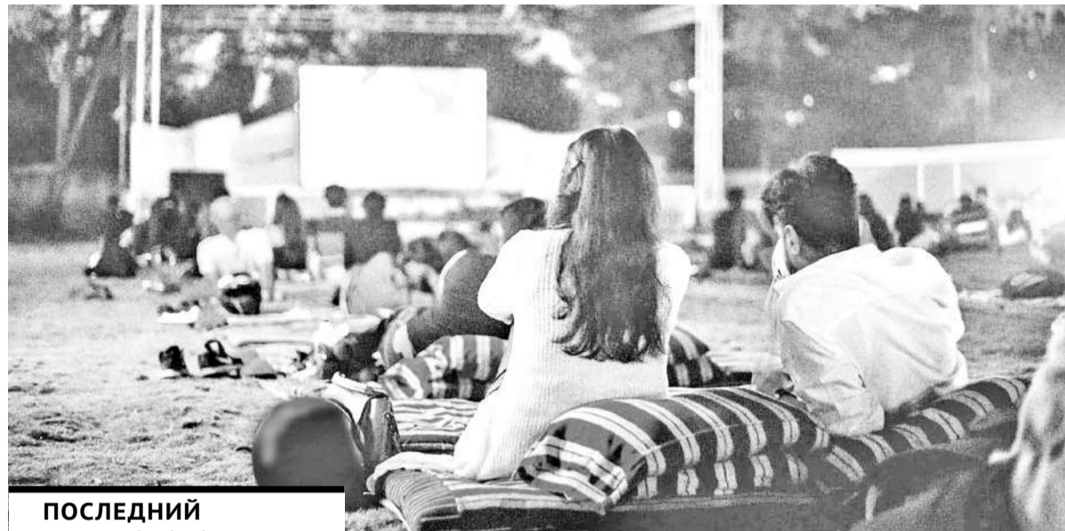
ПОСЛЕДНИЙ ТРЕНД ЭТОГО ЛЕТА - КИНОТЕАТРЫ ПОД ОТКРЫТЫМ НЕБОМ.

Многие считают, что самый лучший отдых - это отдых на море, но в нашем распоряжении лишь два дня выходных в Нур-Султане. Однако не спешите откладывать в сторону купальные костюмы, ведь и здесь можно позагорать на пляже. К примеру, водоем Коянды встретит гостей домиками с панорамными окнами и палатками-кемпингами, в зоне отдыха «Арасан» есть множество развлечений, таких как катамараны, катера, гидроциклы, «бананы», а также аттракцион «Шар». Немногие знают и об