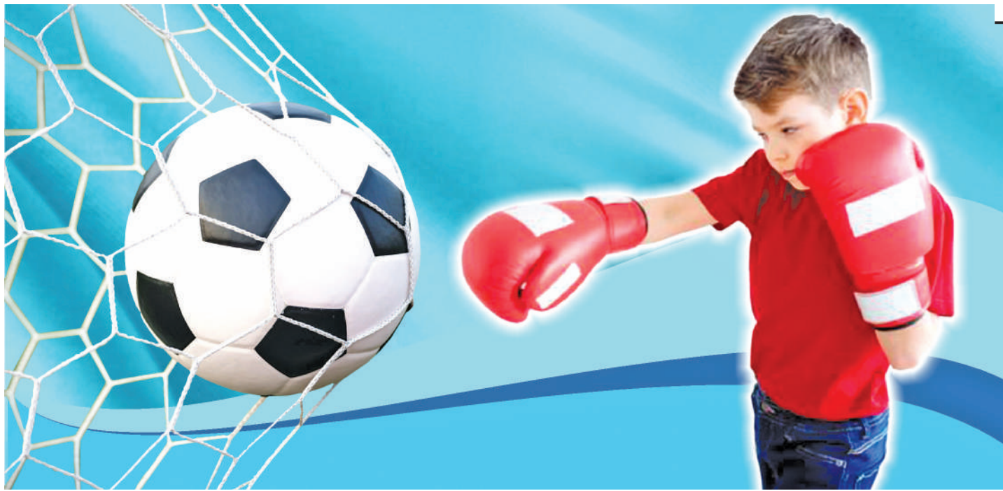
Коллаж Наталья РОМАНОВСКАЯ

федерации по греко-римской, вольной и женской борьбе, все внимание чиновников нужно переориентировать в сторону тех видов, где спортсмены приносят медали. А особо усилить контроль, утяжелить материально-техническую базу для тех, кто борется за пьедестал чести на летних и зимних Олимпийских играх. Результаты последних выступлений показали, что в отечественном спорте накопилось много проблем, которые пора решать.