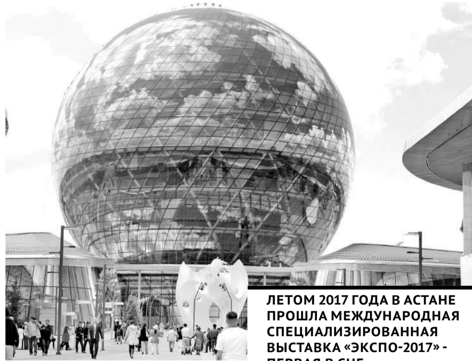
ЛЕТОМ 2017 ГОДА В АСТАНЕ ПРОШЛА МЕЖДУНАРОДНАЯ СПЕЦИАЛИЗИРОВАННАЯ ВЫСТАВКА «ЭКСПО-2017» - ПЕРВАЯ В СНГ.

В прошлом году мы торжественно отмечали 30 лет Независимости нашей республики. А столица Казахстана - Нур-Султан - будет встречать свой 24-й день рождения. Важнейшие страницы истории города уже написаны, но впереди еще множество важных дел, судьбоносных встреч, ярких событий, которые мы будем переживать вместе с нашей любимой столицей.