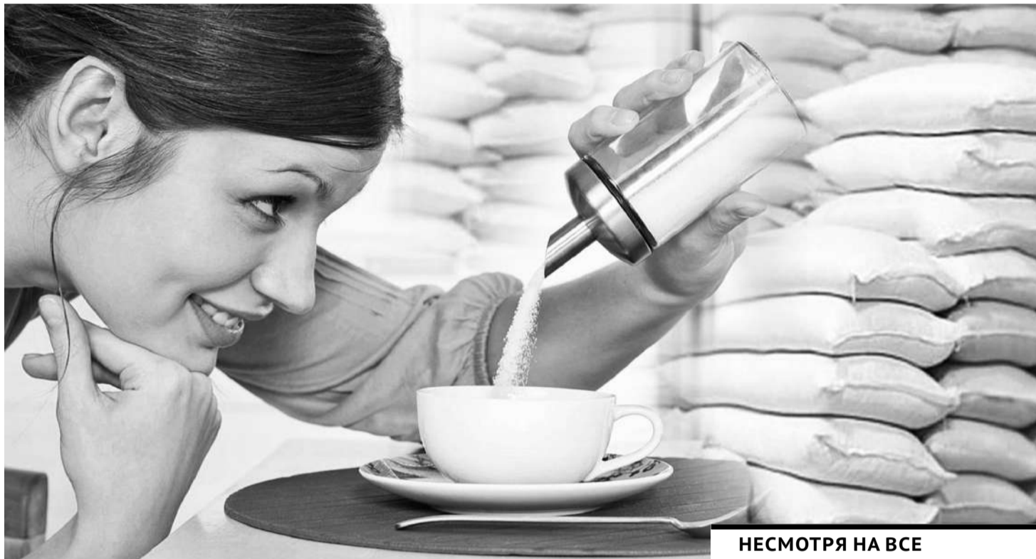
Коллаж Юрия Вилушенко

К осени сахар может подорожать до 1 000 тенге за килограмм