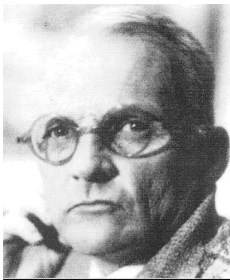
ГЕНРИХ ФОГЕЛЕР (1872-1942)