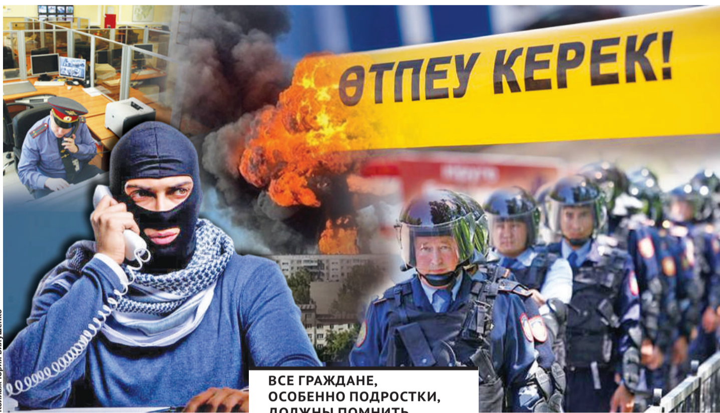
Коллаж Юрия Вышинева

- Например, один из жителей Тимиртау, испытывая материальные затруднения, заложил свои золотые изделия в ломбард, расположенный в здании торгового дома. Понимая, что в оговоренный договором срок оплатить указанную сумму и возратить заложенное имущество не сможет, он испугался, что указанные ценности могут быть реализованы через торги. И позвонил в администрацию торгового дома, сообщив ложные сведения о готовящемся акте терроризма. Таким образом он рассчитывал потянуть время до появления у него денег для оплаты залога. В другом случае мотивом послужила месть. Так, пьяный житель Караганды на своем дачном участке услышал шум ремонта у соседей, сделал им замечание и попросил прекратить работы, на что получил отказ. Разозлившись, со своего сотового телефона позвонил в полицию, но остался не удовлетворен ответом полицейских. В результате повторно позвонил на номер экстренной службы и сообщил о якобы заложенной бомбе в ТД «ЦУМ». В обоих