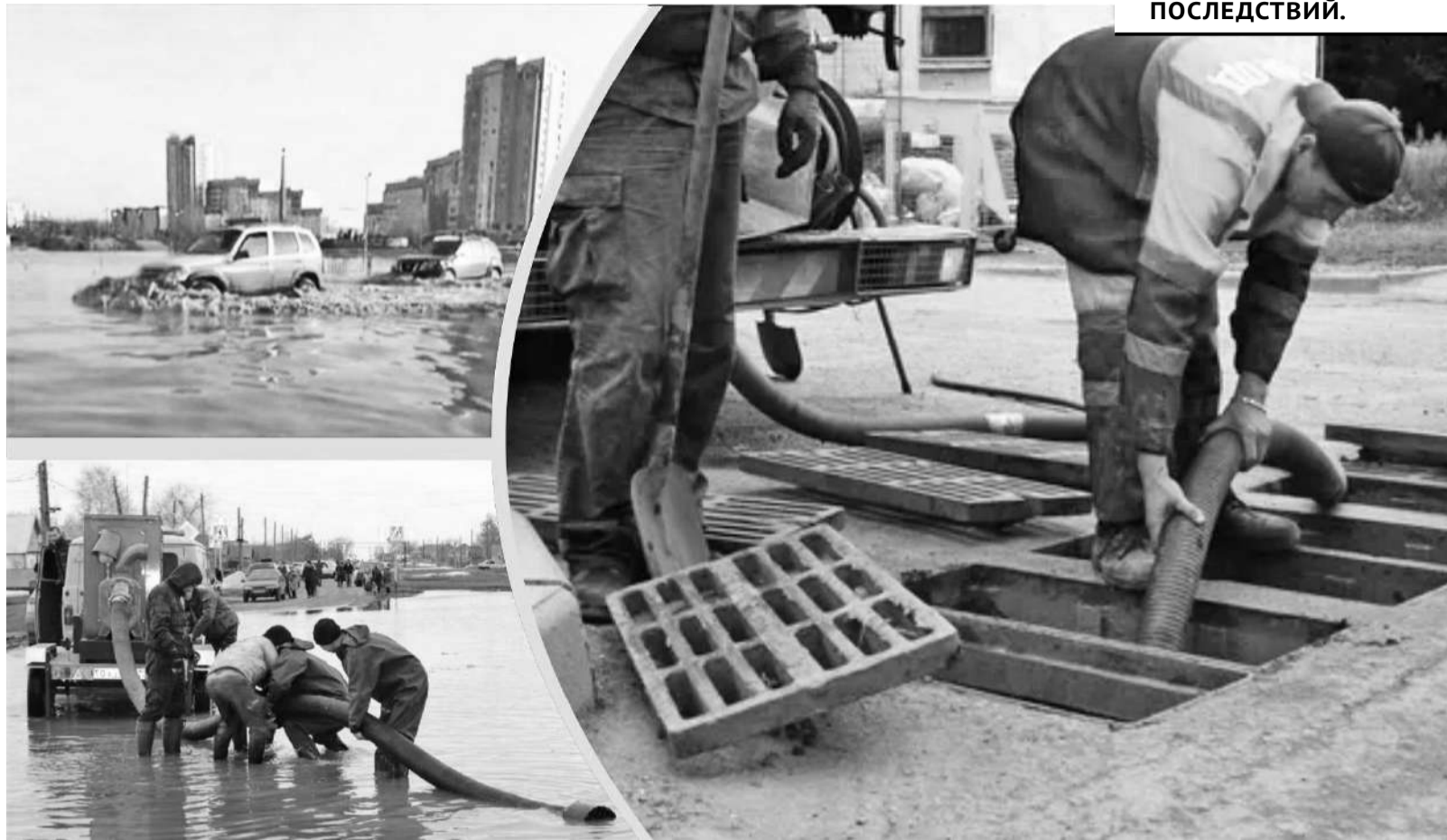
Коллаж Юрия Вилушенко

Ранее на эти цели определили 450 миллионов тенге, - сказал руководитель Аликбек Дюсембеков. - На сегодняшний день конкурсные процедуры на 150 миллионов тенге завершены. Договор с подрядчиком находится на стадии подписания. На данные средства запланировано провести работы по очистке и текущему ремонту ливневой канализации вдоль автомобильной дороги микрорайонов «Степной-2, 3», в районе ТД «Алмаз», на улице Архитектурной, проспекте Шахтеров, в Сквере любви, парке Победы. Общая протяженность составляет 2,2 километра. В то же время в апреле были выделены дополнительные бюджетные средства в размере 300 миллионов тенге. Сейчас ве-