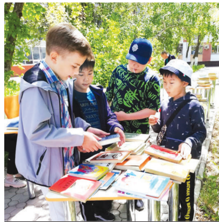
НА ПЛОЩАДИ ПЕРЕД БИБЛИОТЕКОЙ КАЖДЫЙ ЖЕЛАЮЩИЙ СМОЖЕТ ПРИНЕСТИ ЛЮБУЮ КНИГУ ИЗ ДОМА И ОБМЕНИТЬ ЕЕ НА ПРИГЛЯНУВШУЮСЯ.

Работники библиотеки сообщают, что акция продлится до 25 августа. Чаще всего в ней принимают участие люди