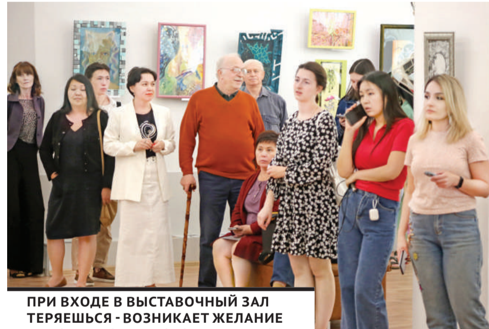
ПРИ ВХОДЕ В ВЫСТАВОЧНЫЙ ЗАЛ ТЕРЯЕШЬСЯ - ВОЗНИКАЕТ ЖЕЛАНИЕ НАХОДИТЬСЯ В НЕСКОЛЬКИХ МЕСТАХ ОДНОВРЕМЕННО.