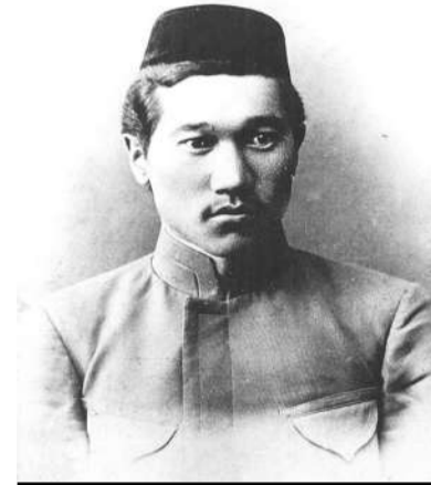
М. ДУЛАТОВ - БЛИЗКИЙ СОРАТНИК А. БАЙТУРСИНОВА, ПРОШЕДШИЙ РЯДОМ С НИМ И НА ЛИТЕРАТУРНОМ ПОПРИЩЕ, И В ГОДЫ БОРЬБЫ ЗА СВОБОДУ НАРОДА.

«Оян, казак!» со времени своего выхода в свет была воспринята как книга, направленная против колониализма, тираж ее был уничтожен, а автор подвергся гонениям и неоднократно заключался в тюрьму. Особенно тяжелым оказалось для Миржакыпа лето 1911 года, когда он по решению