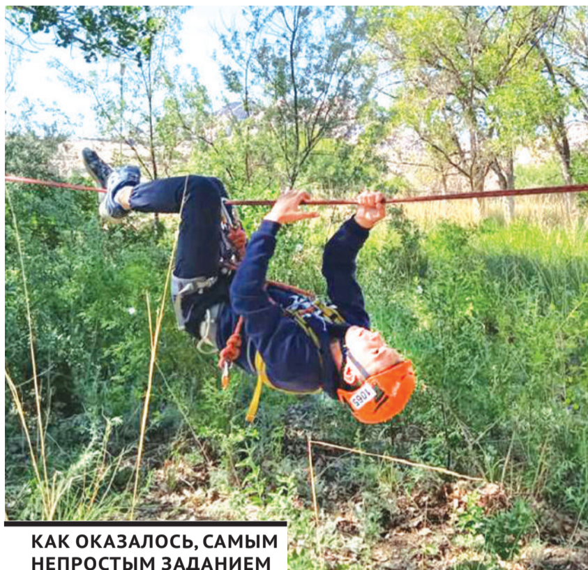
КАК ОКАЗАЛОСЬ, САМЫМ НЕПРОСТЫМ ЗАДАНИЕМ В ТУРИСТСКОЙ ПОЛОСЕ ПРЕПЯТСТВИЙ СТАЛА НАВЕСНАЯ ПЕРЕПРАВА.

Во время слета ребятам некогда было скучать. Они вязали различные узоры, ставили палатки, любовались достопримечательностями, чли бар-