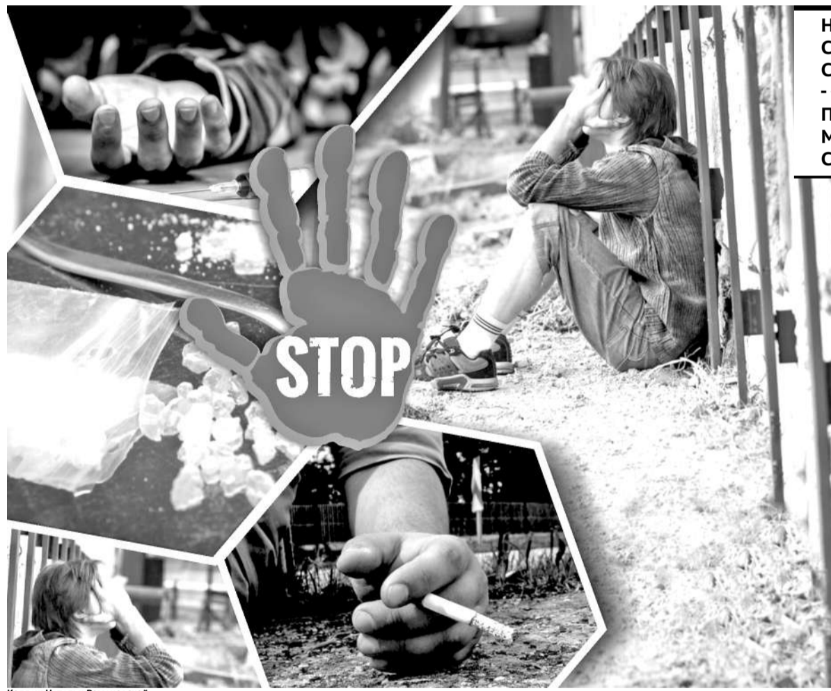
Коллаж Натальи Романовской

Чем обычно «берут» подростки сверстники? Уговорами, что от курения «легких» наркотиков не будет ничего страшного. На самом деле разделение на «легкие» и «тяжелые» вещества весьма ус-