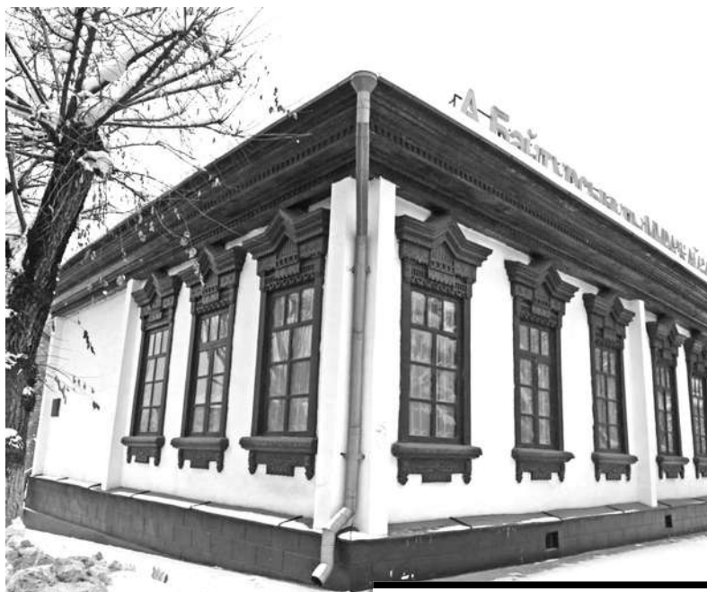
МУЗЕЙ АХМЕТА БАЙТУРСЫНОВА В АЛМАТЫ.

В 1907 году власти арестовали Байтурсынова и посадили в Каркаралинскую тюрьму за критику царской администрации. Позже его освободили. 1 июля 1909 года Ахмет вновь был арестован и посажен в Семипалатинскую тюрьму по обвинению в распространении идеи автономного самоуправления, разжигании национальной вражды между русскими и казахами. Поскольку арестован он был незаконно, то в 1910 году под давлением общественности был выпущен из тюрьмы. С 9 марта 1910 года вплоть до конца 1917-го Байтурсынов жил в Оренбурге.