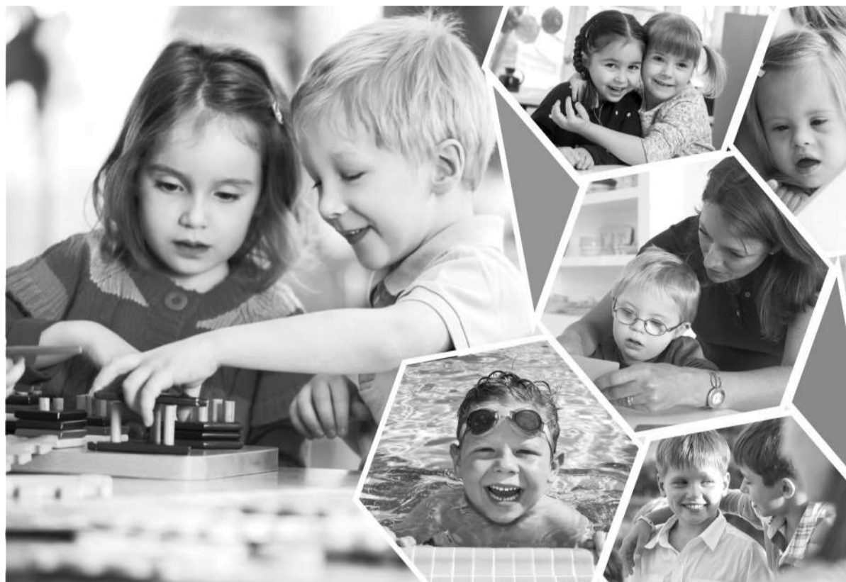
Коллаж Натальи Романовской

В рамках Года детей 12 мая в области проведен областной широкомасштабный рейд «Камкор», направленный на выявление семей с детьми, находящихся в трудной жизненной ситуации и нуждающихся в социальной и медицинской помощи. Участвовали в рейде 885 человек. Обследованы дачные массивы, фермерские хозяйства, подвалы домов, чердачные помещения, железнодорожные и автобусные вокзалы, автомайки. Посещены более 400 неблагополучных семей с проведением профилактических бесед, разъяснением нормы законодательства по вопросам защиты прав и законных интересов несовершеннолетних. Установлены 18 семей, остро нуждающихся в помощи государства, где воспитывается 38 несовершеннолетних. Трудная жизненная ситуация связана с отсутствием документов у родителей, гражданства РК, проживанием в аварийном и ветхом жилье. Дети из данных семей взяты на контроль, будет оказана помощь за счет фонда всеобща. Акимам регионов мы направили письма об оказании семьям