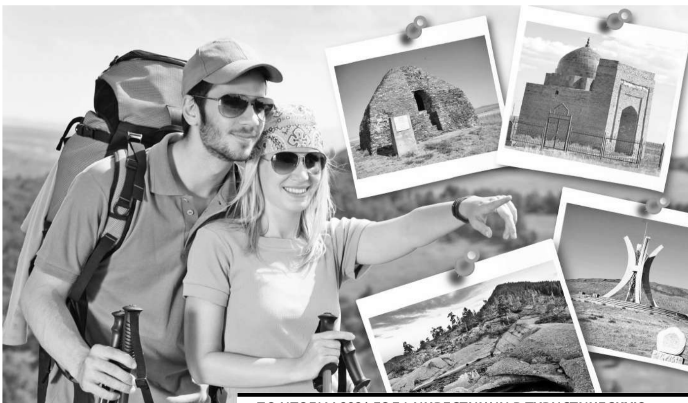
Коллаж Юрия Вилушечко

ПО ИТОГАМ 2021 ГОДА ИНВЕСТИЦИИ В ТУРИСТИЧЕСКУЮ ОТРАСЛЬ СОСТАВИЛИ 27 МЛРД ТЕНГЕ.