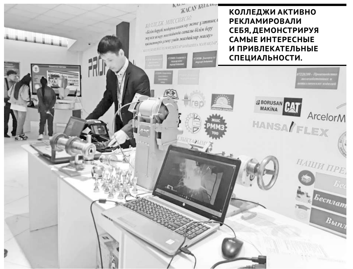
КОЛЛЕДЖИ АКТИВНО РЕКЛАМИРОВАЛИ СЕБЯ, ДЕМОНСТРИРУЯ САМЫЕ ИНТЕРЕСНЫЕ И ПРИВЛЕКАТЕЛЬНЫЕ СПЕЦИАЛЬНОСТИ.