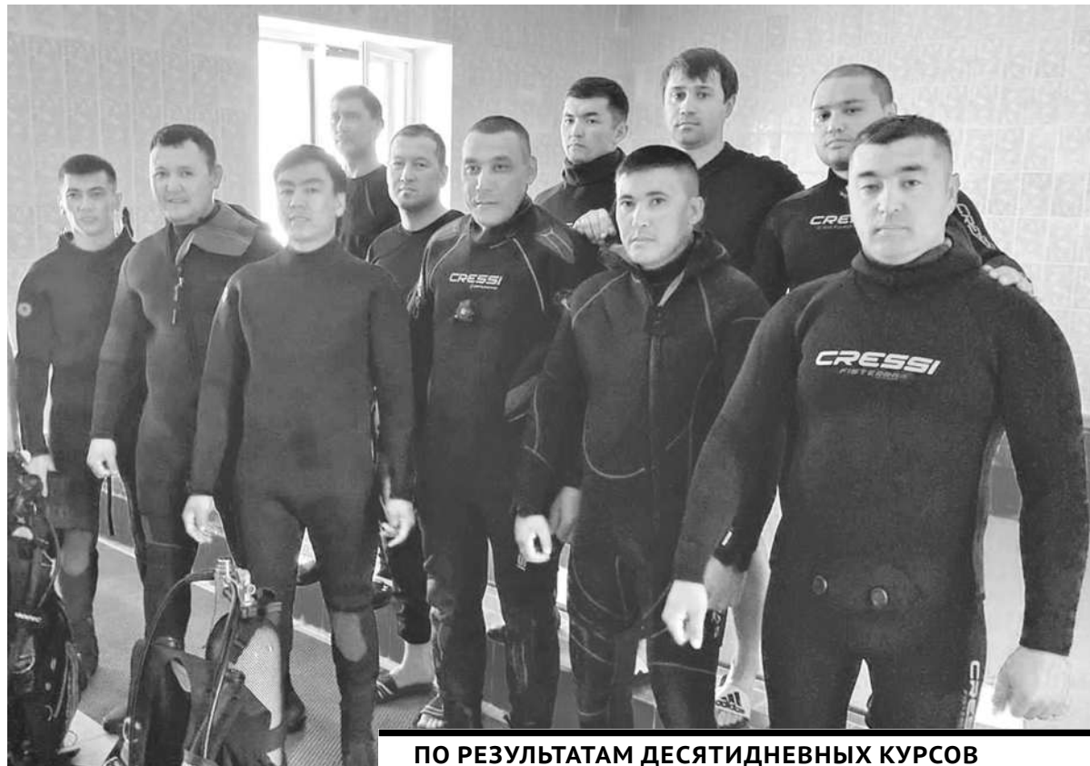
ПО РЕЗУЛЬТАТАМ ДЕСЯТИДНЕВНЫХ КУРСОВ СПАСАТЕЛЕЙ И ВОЕННОСЛУЖАЩИМ БУДЕТ ПРИСВОЕНА КВАЛИФИКАЦИЯ «ВОДОЛАЗ I-II ГРУППЫ СПЕЦИАЛИЗАЦИИ», КОТОРАЯ В ДАЛЬНЕЙШЕМ ПОЗВОЛИТ ПРОВОДИТЬ ПОДВОДНО-ТЕХНИЧЕСКИЕ РАБОТЫ С ПРИМЕНЕНИЕМ ГИДРОДИНАМИЧЕСКИХ ИНСТРУМЕНТОВ СЛЕСАРНЫХ, МОНТАЖНЫХ И ПЛОТНИЦКИХ РАБОТ ПОД ВОДОЙ.

В Приозерске подходит к завершению первый этап курсов обучения и повышения квалификации водолазов МЧС РК, организованный на базе местного спасательного подразделения.