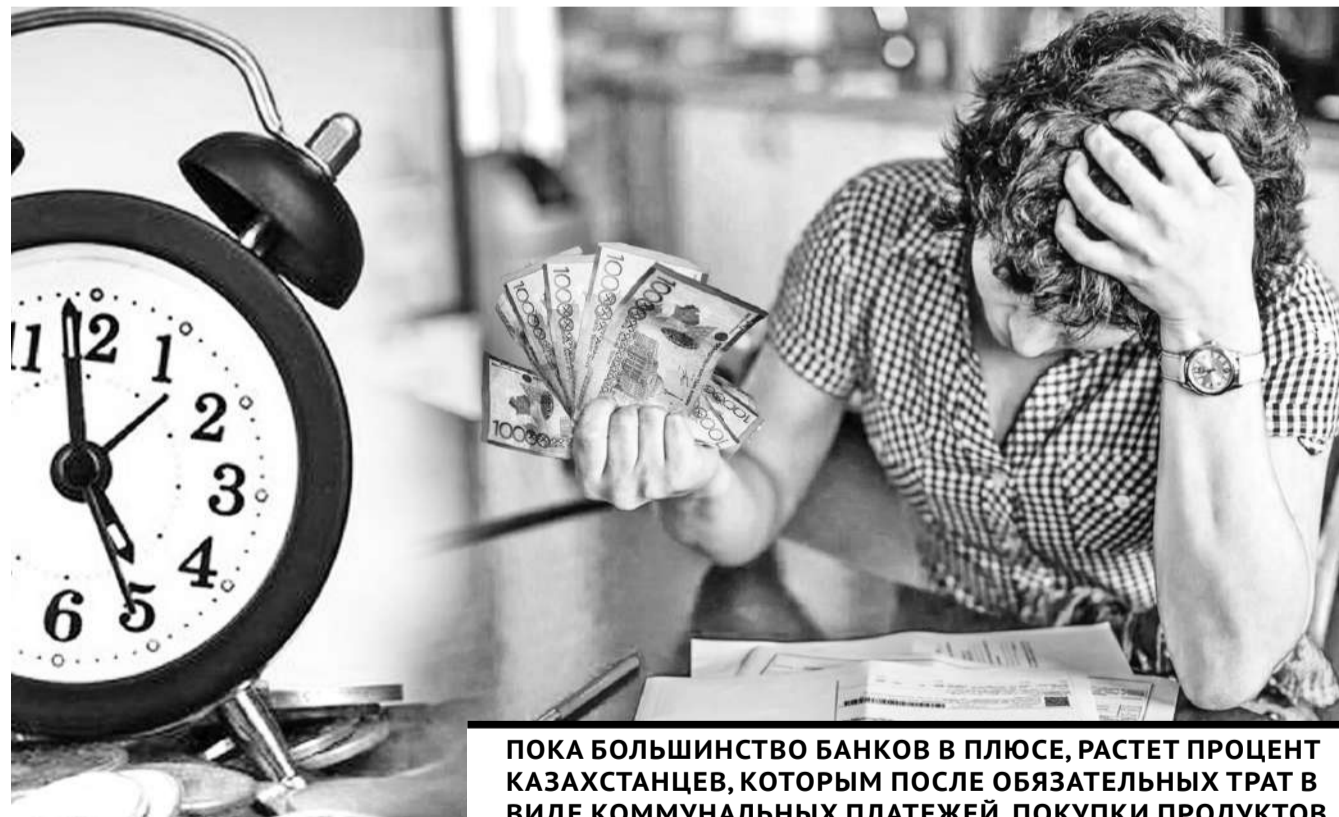
Коллаж Юлия Выхушино

В 2021 году представители Нацбанка РК сообщили, что каждый третий казахстанец имеет один и более потребительских кредитов, лишь каждый седьмой откладывает деньги на будущее. По данным Первого кредитного бюро, каждый пятый «реабилитированный» заемщик вновь допускает просрочки. Вместе с тем банки дают заем клиентам с низким доходом, но часто отказывают тем, у кого заработок выше среднего, но нулевая кредитная история в активе или досрочное погашение.