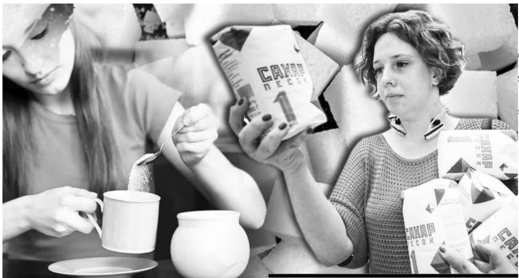
Коллаж Юрия Валушченко

Не сходит с народных уст молва о сахаре, как и не стихает ажиотаж вокруг него. Его стоимость в некоторых магазинах достигла 1 тысячи тенге за килограмм. А в некоторых торговых точках, в том числе и в крупных супермаркетах, его попросту нет.