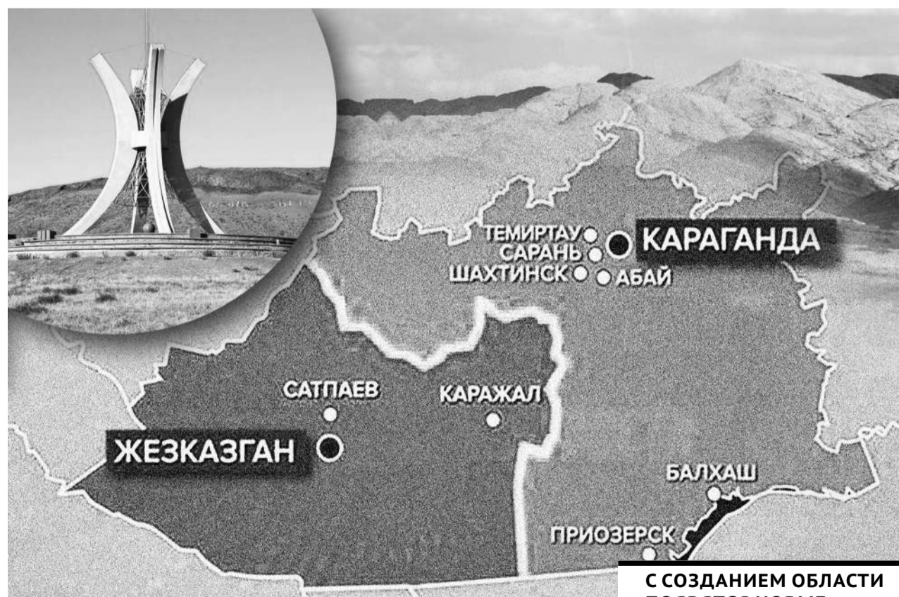
Коллаж: Юрий Быгушено

циалом в развитии промышленности и туризма.