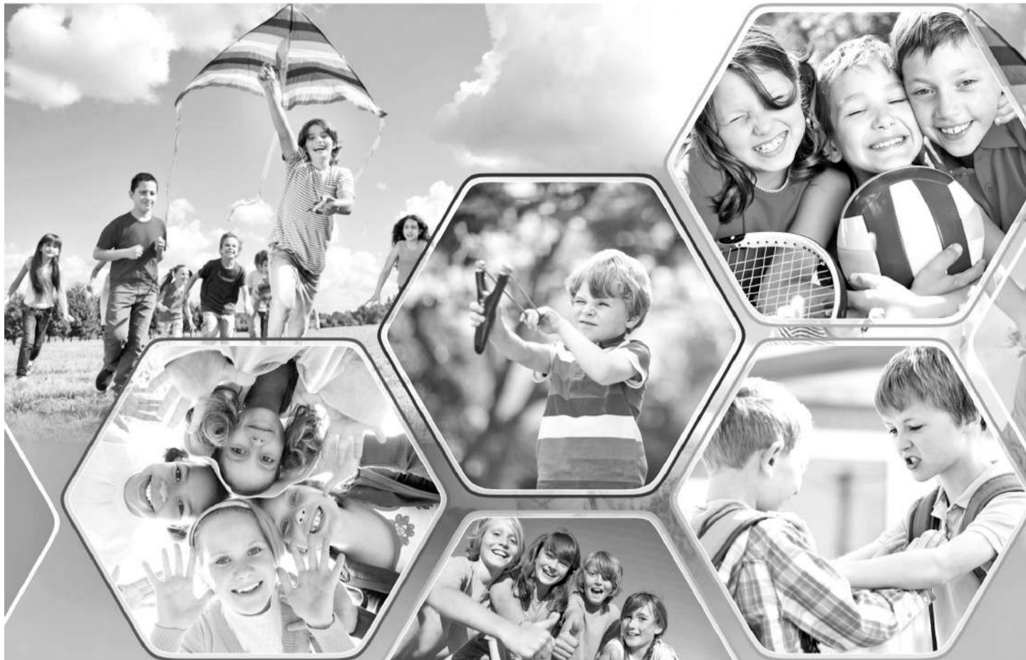
Коллаж Натальи Романовской

Динамика преступлений за последние пять лет показала, что снижение преступлений в подростковой среде почти в два