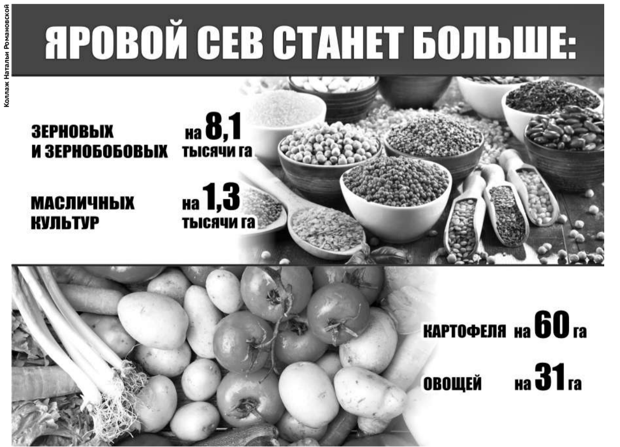
Коллаж Натальи Романовской