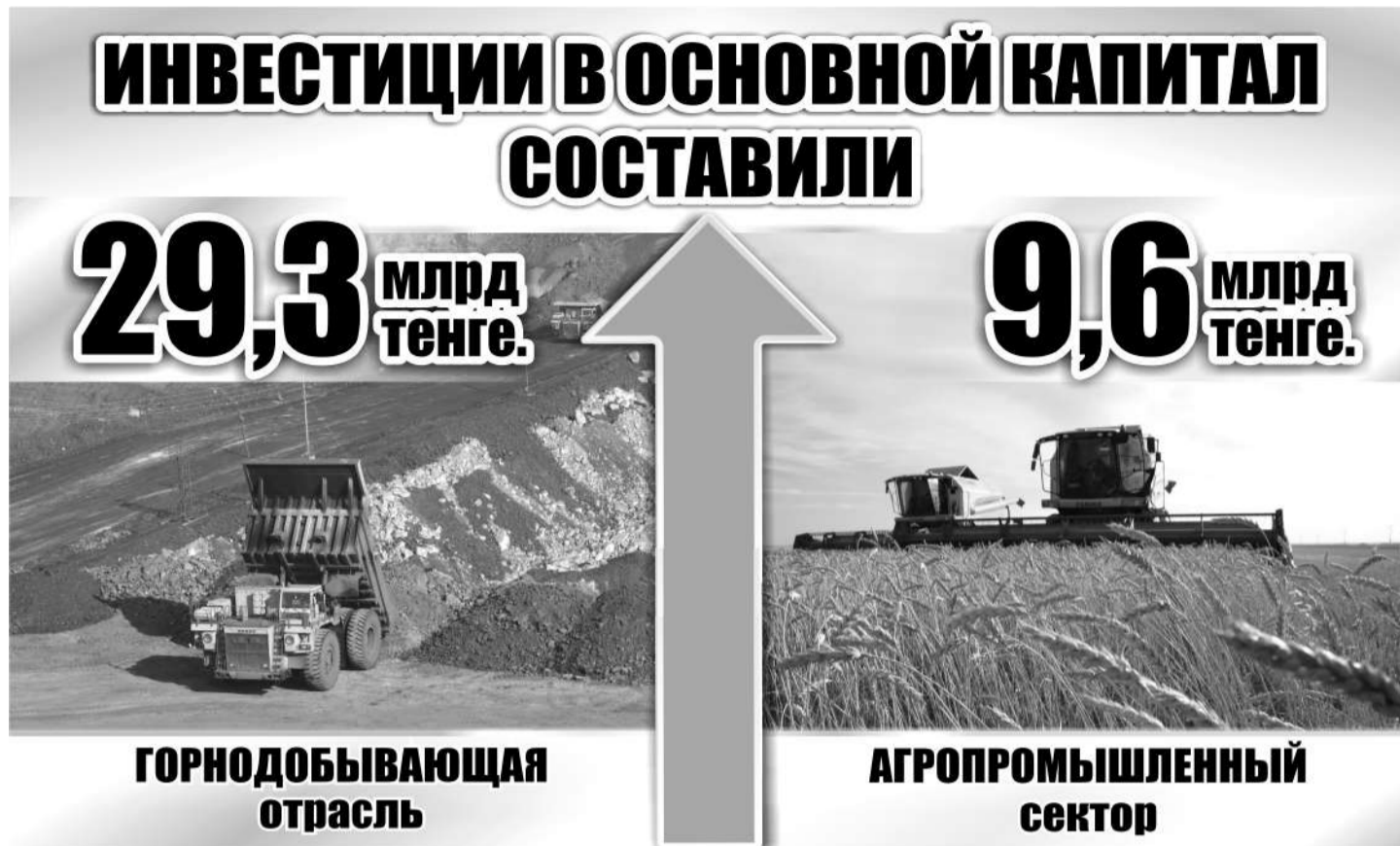
Коллаж Натальи Романовской

Аким признал, что прошедший год был тяжелым для строительной отрасли - из-за роста цен не все планы были реализованы вовремя и в полном объеме. Тем не менее объем строительных работ выполнен на 108,6% и составил 11,8 млрд тенге. В частности, еще в 2020 году начато два крупных проекта - это строительство шести 18-квартирных жилых домов в поселке Осакаровка с инженерно-коммуникационной инфраструктурой. Однако в связи с подорожанием строительных материалов возникла обоснованная необходимость корректировки ранее утвер-