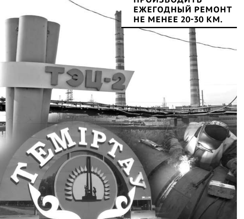
Коллаж Юрия ВИЛУШЕНКО

Особое внимание было уделено и вопросу ремонта автомобильных дорог. На эти цели в нынешнем году выделено свыше 2 миллиардов тенге, в том числе на ремонт дорог в поселке Актау. На сегодняшний день оставляет же-