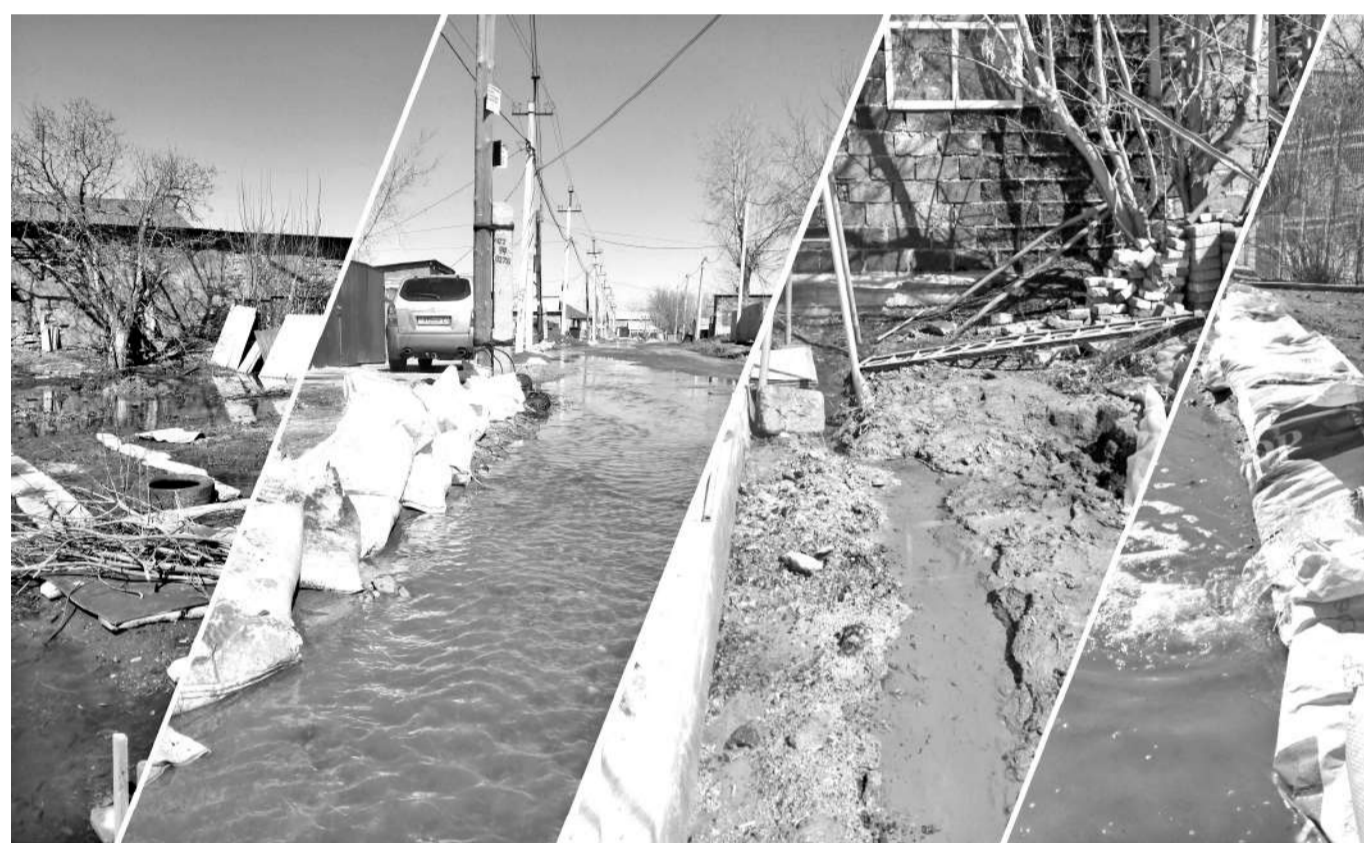
Коллаж Наталья Фомина

Жители нескольких частных домов Караганды каждую весну поднимают вопрос о неудобном соседстве. Организация, расположенная на территории бывшей базы облпотребсоюза, чтобы защитить свои боксы от подтопления, спускает талые воды в их огороды.