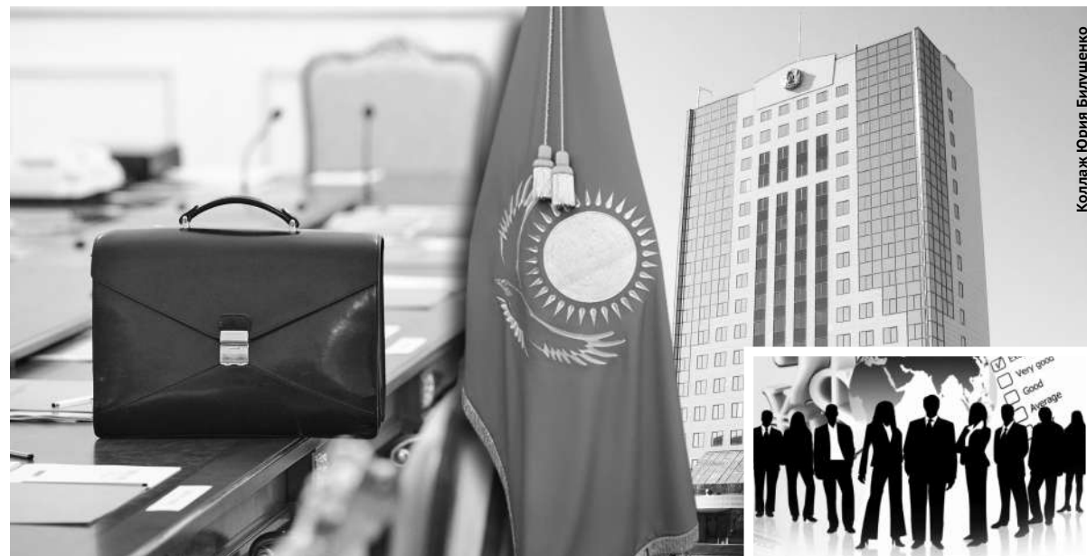
Коллаж Юрия Былушено

В Академии государственного управления при Президенте РК стартовала приемная кампания на 2022 год