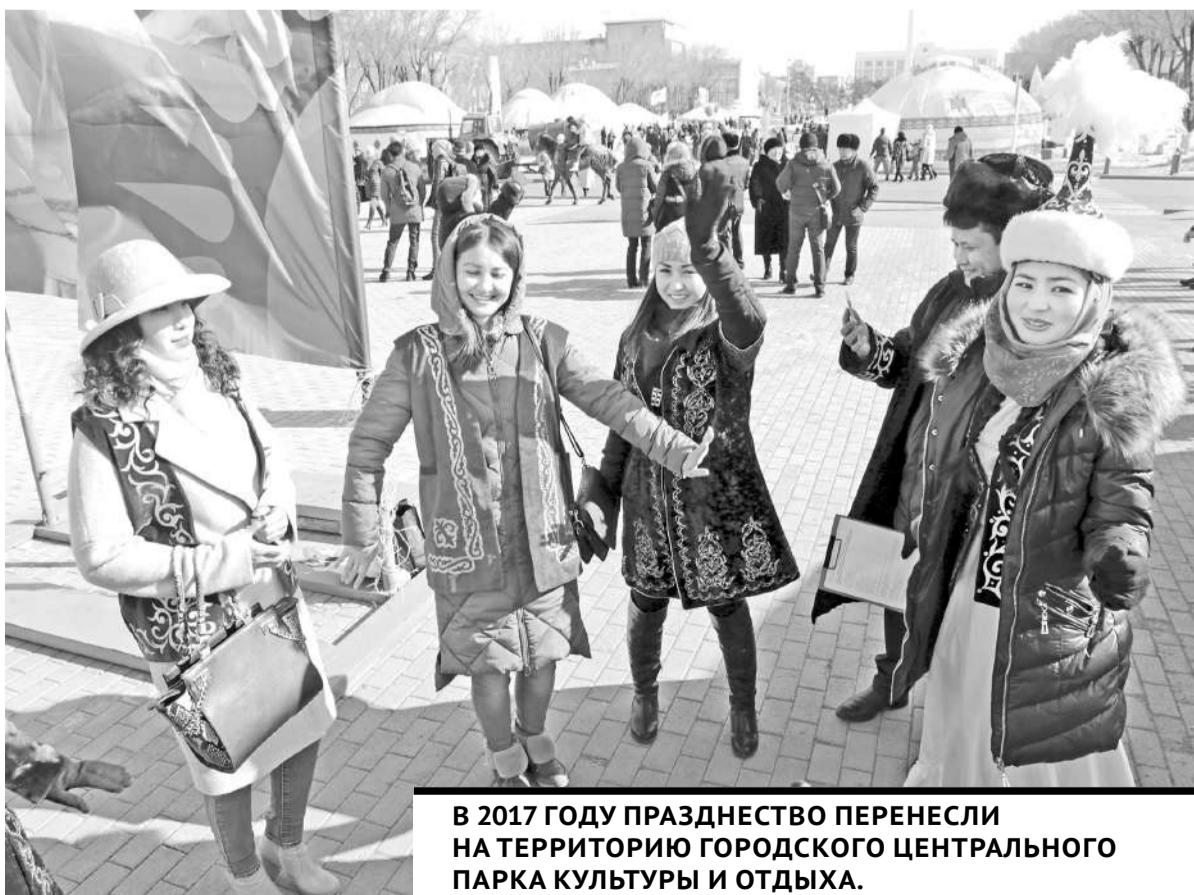
В 2017 ГОДУ ПРАЗДНЕСТВО ПЕРЕНЕСЛИ НА ТЕРРИТОРИЮ ГОРОДСКОГО ЦЕНТРАЛЬНОГО ПАРКА КУЛЬТУРЫ И ОТДЫХА.

Составляя длинный список праздничных гуляний, было бы непростительно забыть легендарное празднование в 2011 году, которое надолго осталось в памяти у жителей Караганды. «Городской праздник начался с шествия. Первыми вступили на проспект Бухар-жырау десять лошадей под опытными всадниками из конно-спортивной школы, следом прошли три колонны курсантов Военной школы-интерната имени Талгата Бигельдинова - ба-