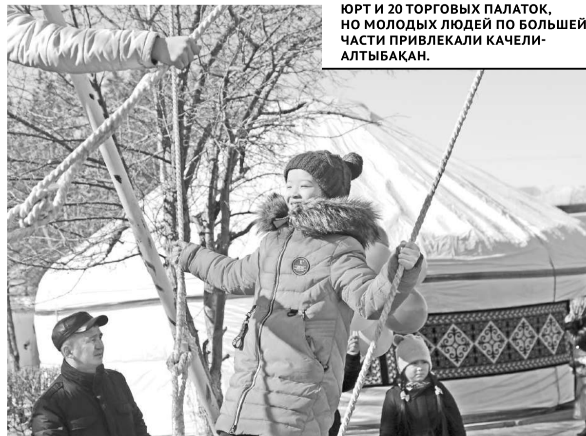
В ЧЕСТЬ ПРАЗДНИКА РЯДОМ С НАБЕРЕЖНОЙ УСТАНОВИЛИ 30 ЮРТ И 20 ТОРГОВЫХ ПАЛАТОК, НО МОЛОДЫХ ЛЮДЕЙ ПО БОЛЬШЕЙ ЧАСТИ ПРИВЛЕКАЛИ КАЧЕЛИ-АЛТЫБАҚАН.