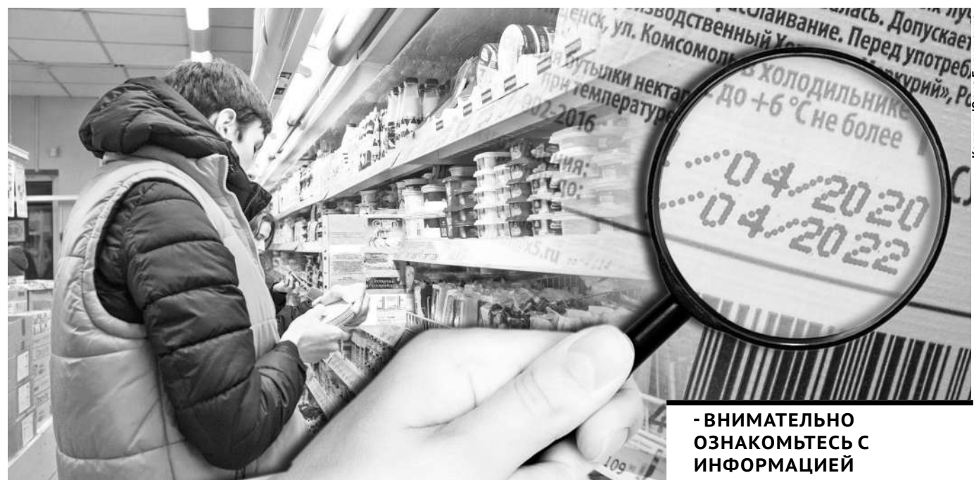
Коллаж Юрия Булученко

По возвращении из магазина настроение хозяйки было подпорчено. Разбирая покупки, решила угостить внуков вкусняшкой - свежим йогуртом. Открыла упаковку, а на поверхности розовой массы - плесень.