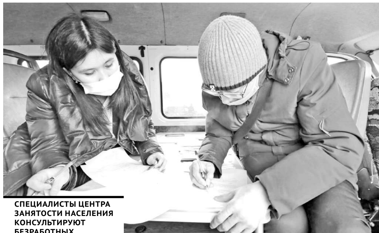
СПЕЦИАЛИСТЫ ЦЕНТРА ЗАНЯТОСТИ НАСЕЛЕНИЯ КОНСУЛЬТИРУЮТ БЕЗРАБОТНЫХ, САМОЗАНЯТЫХ И ДОМОХОЗЯЕК.

Имея при себе удостоверение личности, расчетный счет для перечисления зарплаты и заявление, можно получить консультацию у сотрудника центра занятости населения, который оперативно предоставит варианты для трудоустройства.