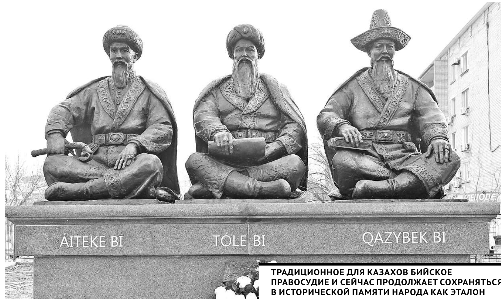
ТРАДИЦИОННОЕ ДЛЯ КАЗАХОВ БИЙСКОЕ ПРАВОСУДИЕ И СЕЙЧАС ПРОДОЛЖАЕТ СОХРАНЯТЬСЯ В ИСТОРИЧЕСКОЙ ПАМЯТИ НАРОДА КАК ЭТАЛОН ЗАКОННОСТИ И СПРАВЕДЛИВОСТИ.

При выдвигании каких-либо лиц в роли судебных арбитров в практике разрешения общественных противоречий определяющую роль играл принцип меритократии (власти наиболее одаренных), согласно которому биями могли стать только самые талантливые, авторитетные и опытные народные судьи, имевшие солидные познания в обычном праве казахов. При этом никакого права прямого наследования звания бия в казахских правовых традициях не допускалось. Однако принцип меритократии не исключал принципа проявления такой возможности, когда ближайший потомок какого-либо казахского бия (сын, внук, правнук) также могли быть избраны биями. Материальное благосостояние, степень влиятельности индивида и прочие субъективные факторы нередко способствовали закреплению бийского звания за отдельными династиями казахов, в чем проявлялась большая социальная значимость среди кочевников принципа генеалогического родства. Но даже сама по себе генеалогическая близость к представителю бийского сословия еще не гарантировала претенденту на этот ранг желаемого избрания