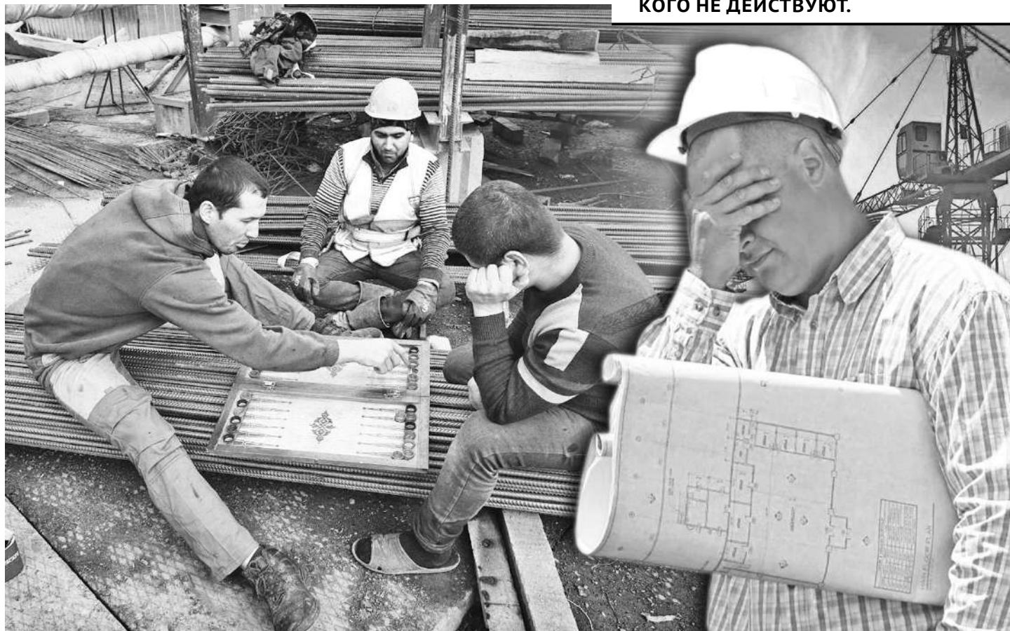
Коллаж Юрия Булученко

- И все потому, что сегодня четко не определены взаимоотношения между исполнителем и работодателем, - сказал он. - Наемный сотрудник может спокойно позволить себе не выйти на работу. Очень низкая самодисциплина. Из-за одного может пойти простой всей смены. А это огромные убытки. Дисциплинарные взыскания в виде записей в трудовой книжке («Замечание», «Выговор», «Строгий выговор») сейчас ни на кого не действуют. А если такой человек трудоустроен неофициально, то никаких правовых последствий для него и вовсе не будет. Анализ показывает, что около 60 процентов рабочих на стройках не имеют никаких трудовых отношений. И с этим пора