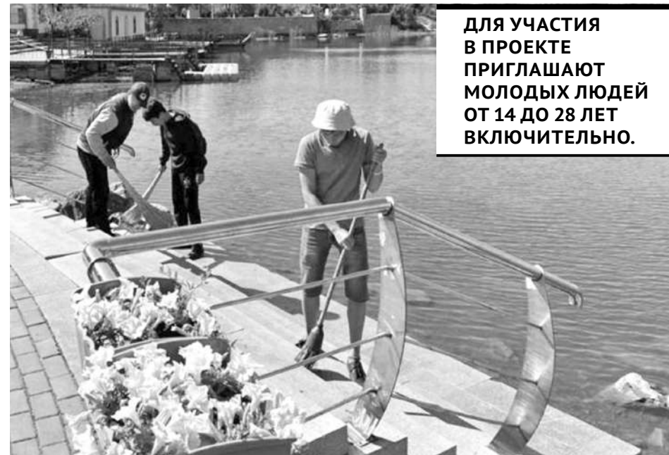
ДЛЯ УЧАСТИЯ В ПРОЕКТЕ ПРИГЛАШАЮТ МОЛОДЫХ ЛЮДЕЙ ОТ 14 ДО 28 ЛЕТ ВКЛЮЧИТЕЛЬНО.

Ежегодно в регионе проводится работа по совершенствованию организации летней сезонной занятости молодежи. Например, реализуется проект трудовых отрядов «Жасыл ел». В нем, кстати, вырос уровень заработной платы и ускорился процесс ее получения.