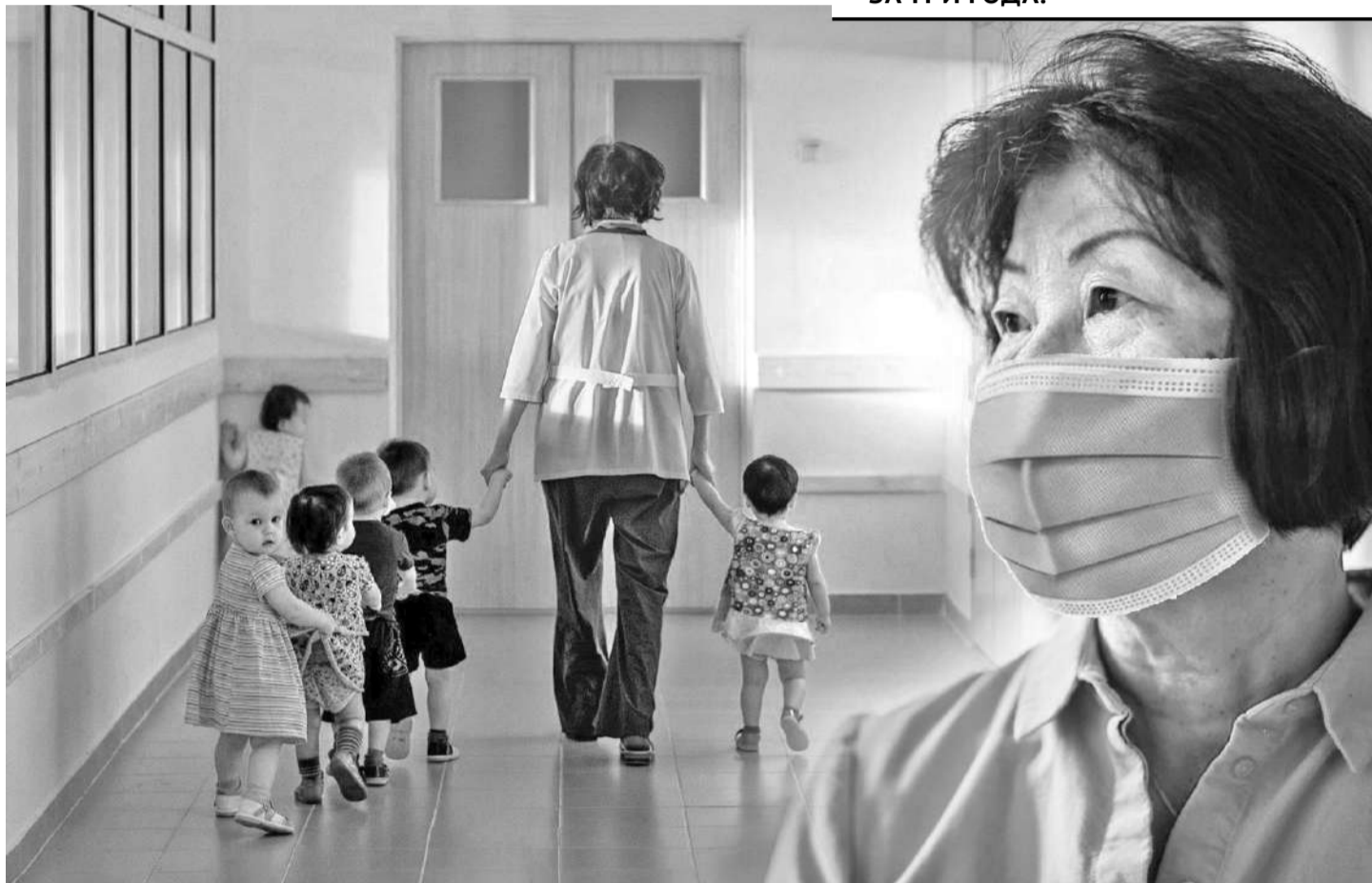
Коллаж Юрия Вилушевского

Базовый должностной оклад у нас составляет чуть больше 17 тысяч тенге. Согласно постановлению № 1400 от 29.12.2007 года от этой суммы и рассчитывались 30% доплаты за работу с детьми, оставшимися без попечения родителей. Помимо педагогов эти средства поступали и техническому персоналу. В 2015 году появилось постановление № 1193, где пункт о выплате надбавок сохранился. Более того, в феврале 2021 года Министерство образования и науки направило письмо Комитету внутреннего государ-