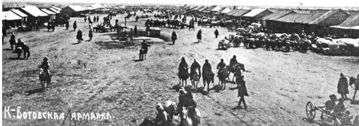
К. Ботовская ярмарка

В годы революции и гражданской войны ярмарка, по понятным причинам, прекратила свою деятельность. Она возродилась после того, как был взят курс на НЭП (Новая экономическая политика), проводившаяся в Советском Союзе. Принята 14 марта 1921 года X съездом РКП(б), что повлекло оживление частного капитала. Соответственно, с 1922 года на ярмарке восстановили традицию проведения культурно-массовых мероприятий. В отремонтированном народном доме проводились айтысы, действовали своеобраз-