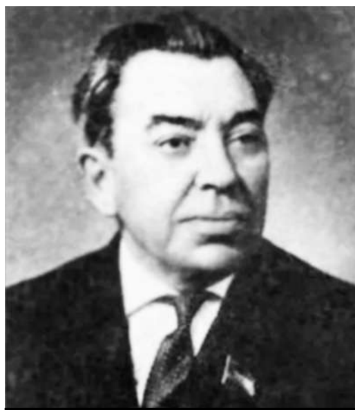
ИВАН ПЕТРОВИЧ ШУХОВ.

ривал в большой печати. Радовался и не знал, что над Шуховым гремел гром. На второй день после поступления журнала в продажу в ЦК республики поступил донос: