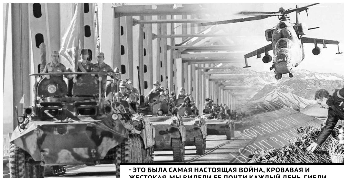
Коллаж Юрия Выпущенко