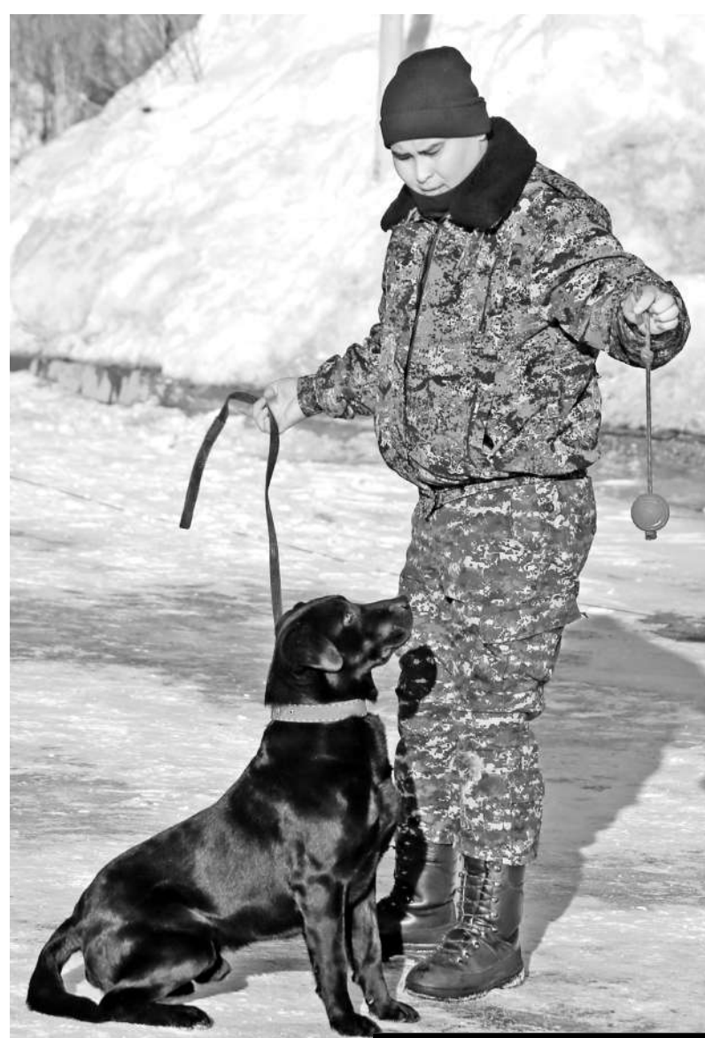
ЛАБРАДОР-РЕТРИВЕР ПО КЛИЧКЕ БАКС ВО ВРЕМЯ ОДНОГО ИЗ ВЫЕЗДОВ ОБНАРУЖИЛ В ОТСЕКЕ ДЛЯ ИНСТРУМЕНТОВ ГРУЗОВОЙ ФУРЫ 5 КГ ГАШИША.

В городских условиях взять след удается сложнее - очень много раздражителей и отвлекающих моментов, которые мешают работе пса. Это газовые выхлопы автомобилей, мусор и прочее. Однако нередко бывали случаи, когда преступник мог уехать на машине, а служебная собака, уловившая его запах, следовала за ним до нескольких километров. Зачастую это упрощает работу следователей, которые в дальнейшем могут отследить подозреваемого по камерам или путем опроса свидетелей. Ну, а в небольших населенных пунктах, сельской местности следовые собаки нередко приво-