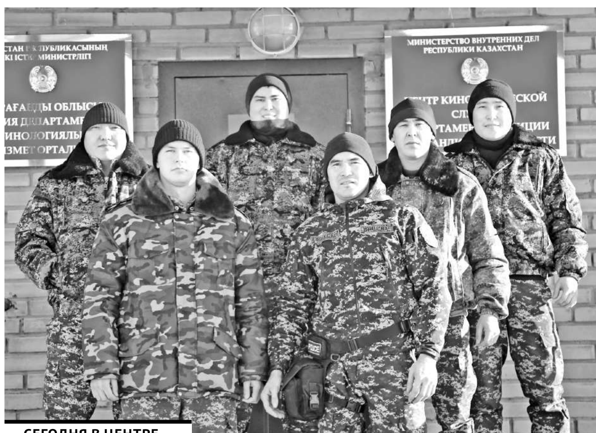
СЕГОДНЯ В ЦЕНТРЕ КИНОЛОГИЧЕСКОЙ СЛУЖБЫ «НА ПОСТУ» - 40 СОБАК И 16 КИНОЛОГОВ.

После чего хвостатых «копеев» приучают к одорологической идентификации. Так называется установление сходства запахов специальной служебно-розыскной собакой. Для этого на начальной стадии дрессировок псов приучают