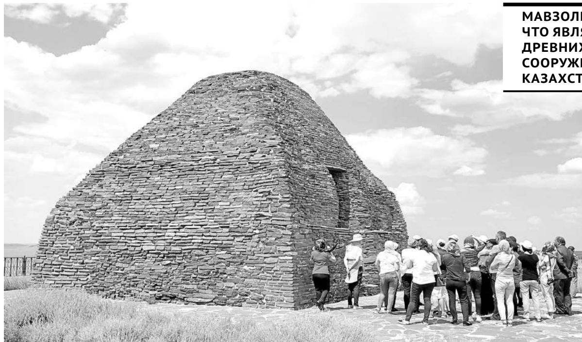
МАВЗОЛЕЙ ПРИМЕЧАТЕЛЕН ТЕМ, ЧТО ЯВЛЯЕТСЯ ОДНИМ ИЗ САМЫХ ДРЕВНИХ МОНОМЕНТАЛЬНЫХ СООРУЖЕНИЙ ЦЕНТРАЛЬНОГО КАЗАХСТАНА.

Домбауыл - одно из крупнейших сооружений из камня в Казахстане, построенных еще в доисламский период. Взгляды ученых по поводу предназначения и даты его постройки расходятся. Распространено мнение, что это ритуальный мемориал, связанный с тенгрианством.