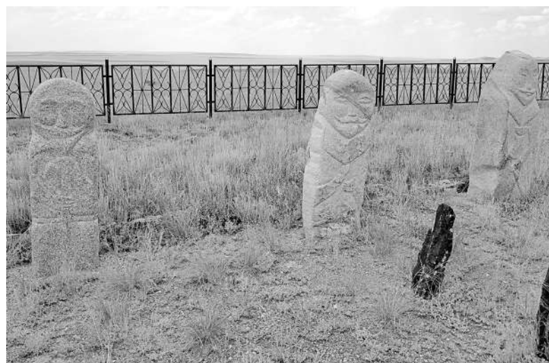
ОТЛИЧИТЕЛЬНОЙ ЧЕРТОЙ АРХИТЕКТУРНОГО СТИЛЯ ДОМБАУЫЛА ОТ ДРУГИХ ДЫНОВ ЯВЛЯЕТСЯ ПРЯМОУГОЛЬНАЯ СТРУКТУРА НИЖНЕЙ ЧАСТИ, РАЗМЕРАМИ 8,9X7,9 М И ТОЛЩИНОЙ СТЕН ОКОЛО 2 М. ВОКРУГ САМОГО ДЫНА ИМЕЕТСЯ МНОЖЕСТВО ЗАХОРОНЕНИЙ С БАЛБАЛАМИ.

Созвучное вышеупомянутым легендам сказание гласит следующее. Домбауыл-аулие вместе с соплеменниками кочевал по долине реки Каракенгир вместе с верным другом Дуа-сокыр. Оба они очень любили охоту. Но у Домбауыла было еще одно увлечение - по вечерам он прекрасно играл на кобызе, при звуках его чудесных мелодий все вокруг замирало - и весенняя степь в огненно-алых