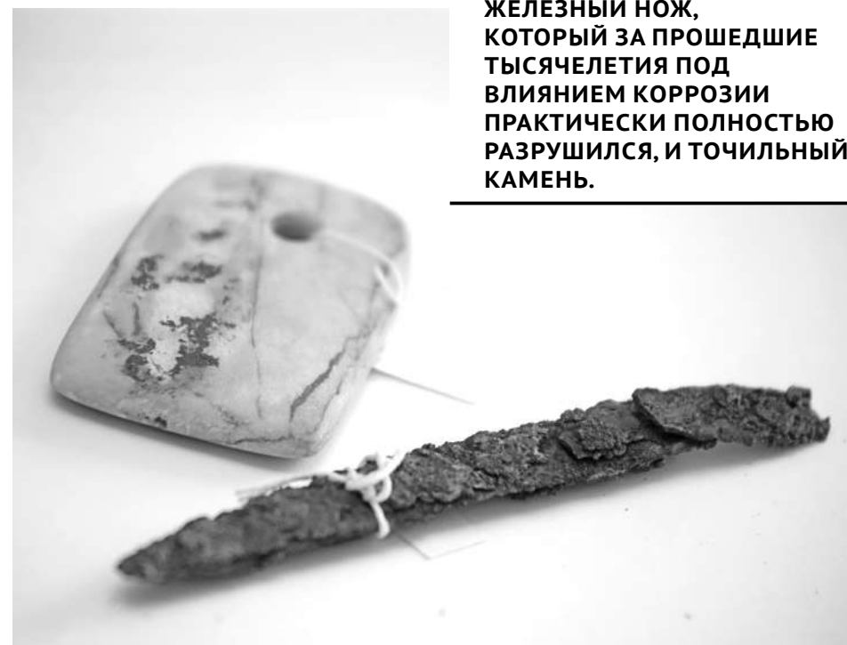
ЖЕЛЕЗНЫЙ НОЖ, КОТОРЫЙ ЗА ПРОШЕДШИЕ ТЫСЯЧЕЛЕТИЯ ПОД ВЛИЯНИЕМ КОРРОЗИИ ПРАКТИЧЕСКИ ПОЛНОСТЬЮ РАЗРУШИЛСЯ, И ТОЧИЛЬНЫЙ КАМЕНЬ.

но назвать перстнем. Но здесь обращает на себя внимание форма. Это непривычная нам шинка. Украшение представляет собой полосу, изготовленную из 7-9 тонко скрученных золотых нитей, соединенных между собой пайкой. Таким образом, кольца разъемные. Понять, предназначались они мужчине или женщине, сложно - их конструкция позволяла с легкостью регулировать размер. С другой стороны, можно предположить, что это было все же украшение женщины. На эту мысль наталкивает еще одна находка - зернотерка, представляющая собой два достаточно увесистых булыжника, которые в руках наших праотцев были приняты наиболее удобную форму для ручного помола.