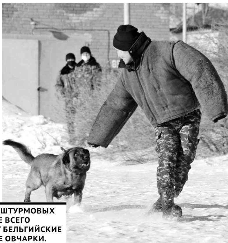
В КАЧЕСТВЕ ШТУРМОВЫХ СОБАК ЧАЩЕ ВСЕГО ВЫСТУПАЮТ БЕЛЬГИЙСКИЕ И НЕМЕЦКИЕ ОВЧАРКИ.