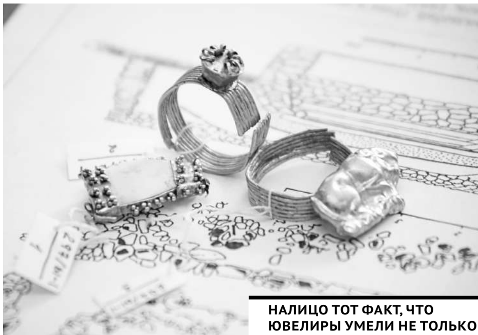
НАЛИЦО ТОТ ФАКТ, ЧТО ЮВЕЛИРЫ УМЕЛИ НЕ ТОЛЬКО ЧЕКАНИТЬ, НО И ПЯТЬ.

Почему речь идет именно о саках, которых «отец истории» Геродот называл массагетами, иранцы - «турами с резвыми конями», а греки «азиатскими скифами»? На такой вывод исследователей натолкнули находки.