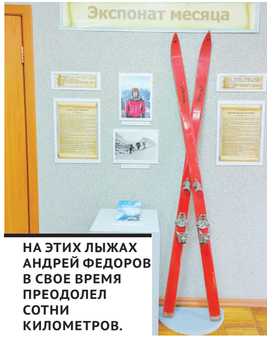
НА ЭТИХ ЛЫЖАХ АНДРЕЙ ФЕДОРОВ В СВОЕ ВРЕМЯ ПРЕОДОЛЕЛ СОТНИ КИЛОМЕТРОВ.