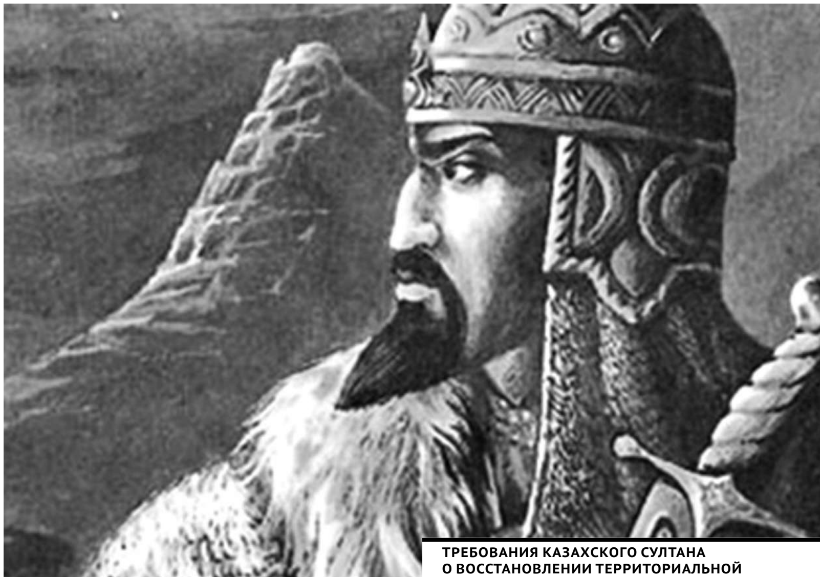
ТРЕБОВАНИЯ КАЗАХСКОГО СУЛТАНА О ВОССТАНОВЛЕНИИ ТЕРРИТОРИАЛЬНОЙ ЦЕЛОСТНОСТИ КАЗАХСТАНА, СОХРАНЕНИИ ЕГО САМОСТОЯТЕЛЬНОСТИ БЫЛИ ИЗЛОЖЕНЫ И В ЕГО ПЕРЕПИСКЕ, АДРЕСОВАННОЙ ИМПЕРАТОРУ НИКОЛАЮ I.

В традициях казахских ханов и султанов было воспитывать своих детей способными встретить суровые превратности судьбы. В