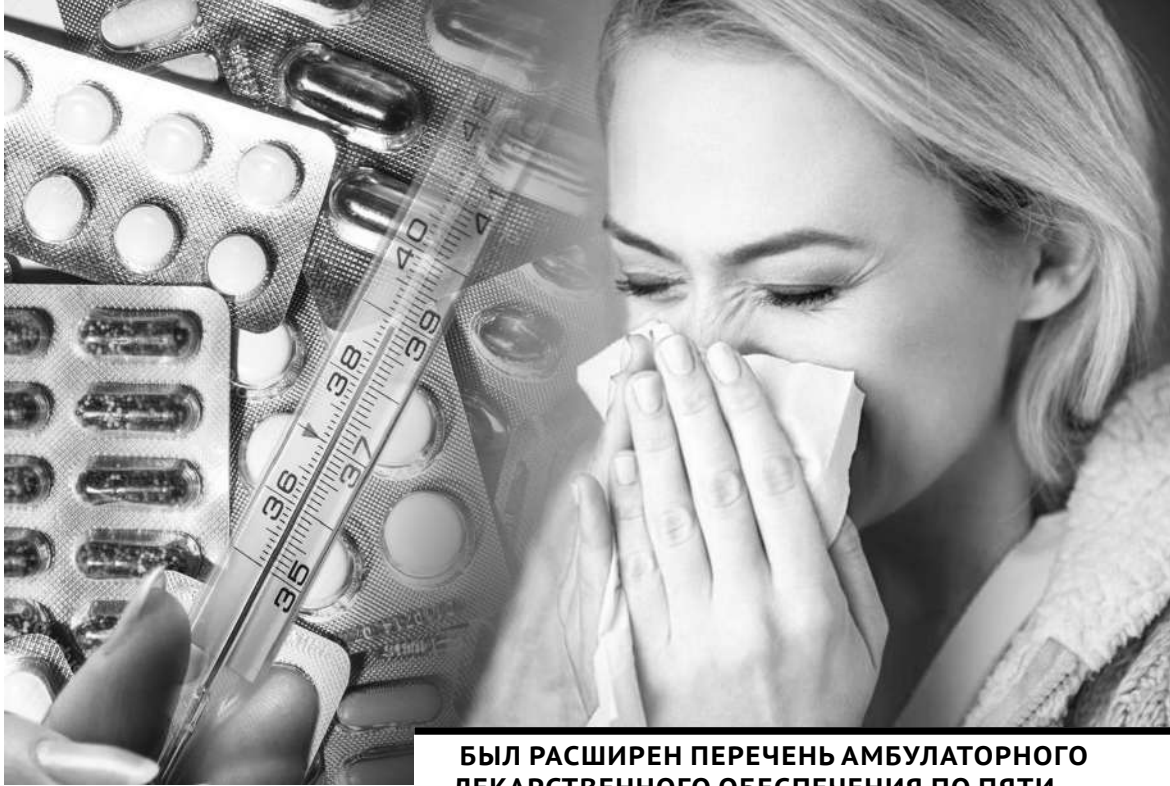
Коллаж Юрия Вилушено

В розничной аптечной сети сформирован двухмесячный запас по 26 лекарствам, закуплены 10 млн масок, в том числе 500 тысяч детских. В рамках гуманитарной помощи созданы запасы СИЗ - 400 тысяч одноразовых костюмов и 10 млн пар медицинских перчаток. Для охвата вакцинацией населения за-