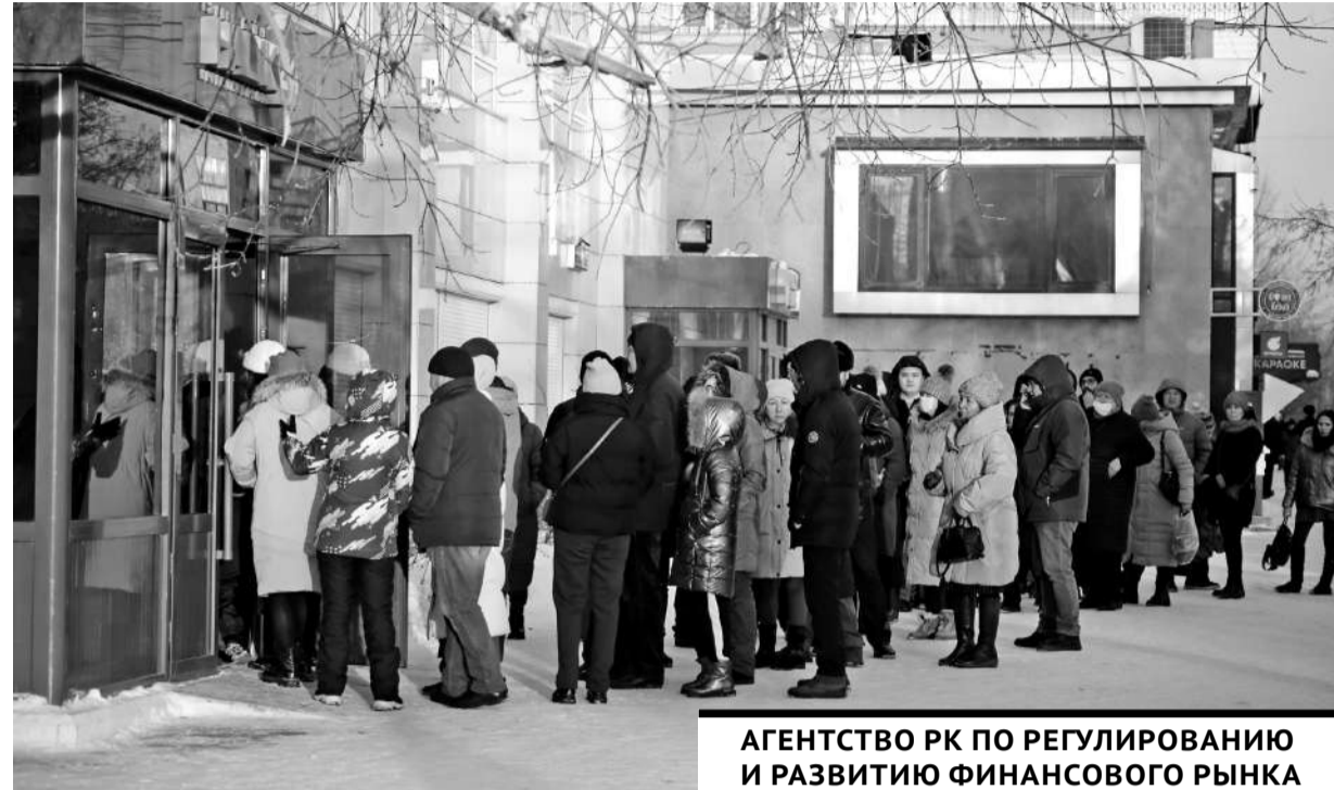
АГЕНТСТВО РК ПО РЕГУЛИРОВАНИЮ И РАЗВИТИЮ ФИНАНСОВОГО РЫНКА И НАЦИОНАЛЬНЫЙ БАНК КАЗАХСТАНА СООБЩАЮТ О ВРЕМЕННОМ ПРЕКРАЩЕНИИ ДЕЯТЕЛЬНОСТИ ВСЕХ ФИНАНСОВЫХ ОРГАНИЗАЦИЙ.

С 6 января в стране не работают ЦОНЫ, сообщили в Министерстве цифровизации и аэрокосмической промышленности. Причина - действие в стране режима ЧП и отсутствие интернета. Нет доступа и к электронным ресурсам Правительства для граждан. Когда вновь начнут функционировать центры обслуживания населения, пока не сообщается.