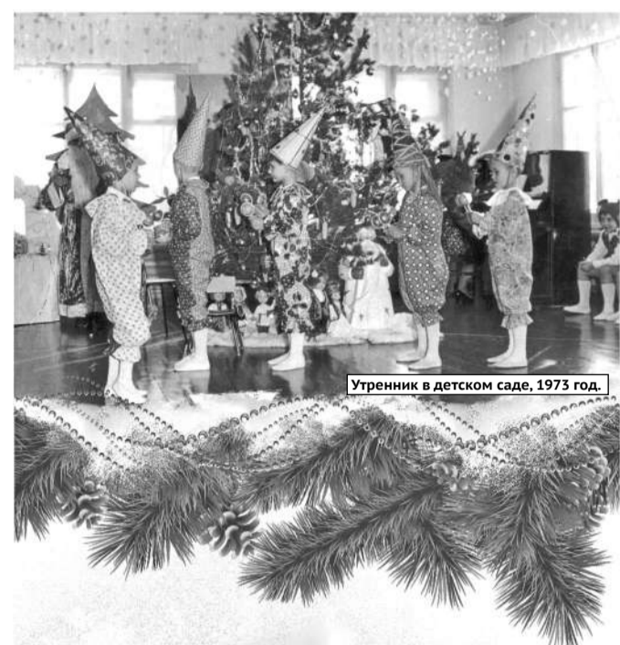
Утренник в детском саду, 1973 год.

От петрушки до супермена: как видоизменялись новогодние костюмы