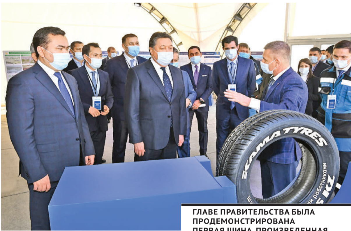
ГЛАВЕ ПРАВИТЕЛЬСТВА БЫЛА ПРОДЕМОНСТРИРОВАНА ПЕРВАЯ ШИНА, ПРОИЗВЕДЕННАЯ СПЕЦИАЛИСТАМИ БУДУЩЕГО ЗАВОДА.

В своем выступлении на торжественном мероприятии, посвященном 30-летию Независимости Республики Казахстан, А. Мамин отметил, что Карагандинская область обладает высоким экономическим потенциалом и вносит огромный вклад в социально-экономическое развитие всей страны. С 1991 года валовой региональный продукт вырос в 24 раза. Карагандинские предприятия производят более 34% каменного угля в стране, 14,5% железной руды, 28% добычи медной руды, 100% плоского проката и марганцевых руд, 82% рафинированной меди, 32,7% аффинированного серебра и 11,1% аффинированного золота. Область производит пятую часть (или 21%) всей обработанной продукции в РК и по праву считается мощным индустриальным центром, занимающим лидирующие позиции в стране.