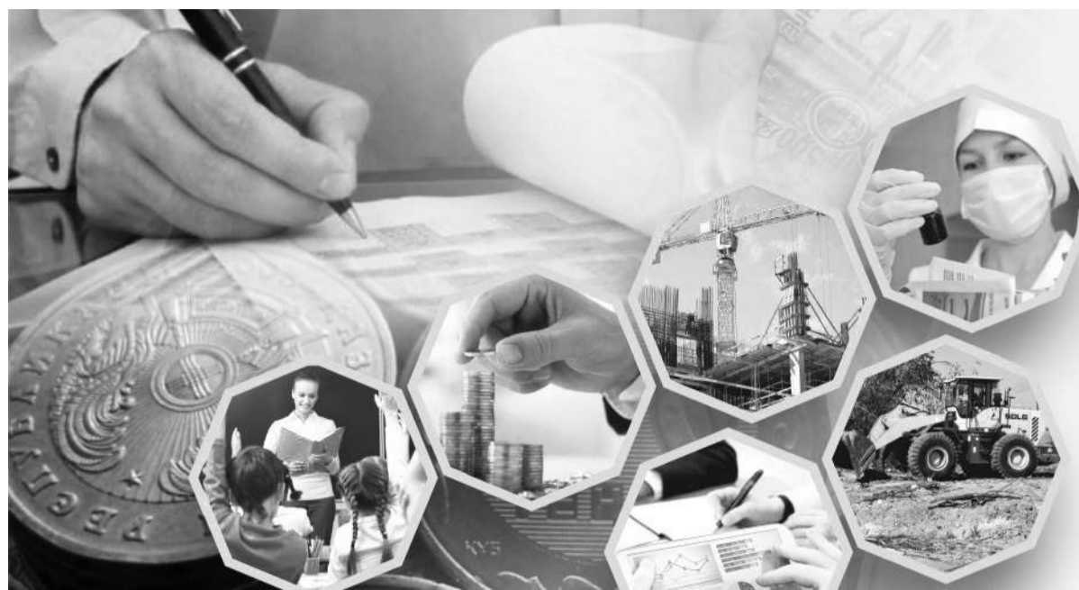
Коллаж Юрия Билушино

В ходе очередной, IX сессии Карагандинского областного маслихата депутаты обсудили и одобрили финансовые планы на 2022-2024 годы. Кроме того, народными избранниками было внесено более 80 актуальных вопросов и предложений в сферах здравоохранения, образования, водоснабжения, транспортной инфраструктуры, экологии, строительства, сельского хозяйства, регулирования природопользования, развития регионов.