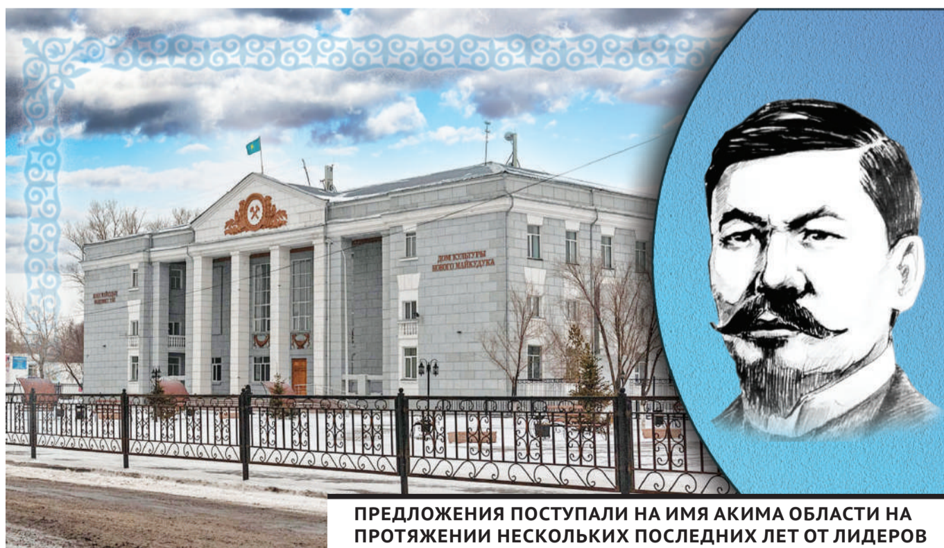
ПРЕДЛОЖЕНИЯ ПОСТУПАЛИ НА ИМЯ АКИМА ОБЛАСТИ НА ПРОТЯЖЕНИИ НЕСКОЛЬКИХ ПОСЛЕДНИХ ЛЕТ ОТ ЛИДЕРОВ ОБЩЕСТВЕННОГО МНЕНИЯ, ВЕТЕРАНОВ, ОТ ОТДЕЛЬНЫХ ГРУПП И КОЛЛЕКТИВОВ.

нешнего года в Караганде прошли масштабные общественные слушания о переименовании Октябрьского района. Процесс ознакомления с мнением местных жителей был организован в 15 пунктах в разных частях города - Майкудуке, Пришахтинске, Сортировке, ЖБИ и других.