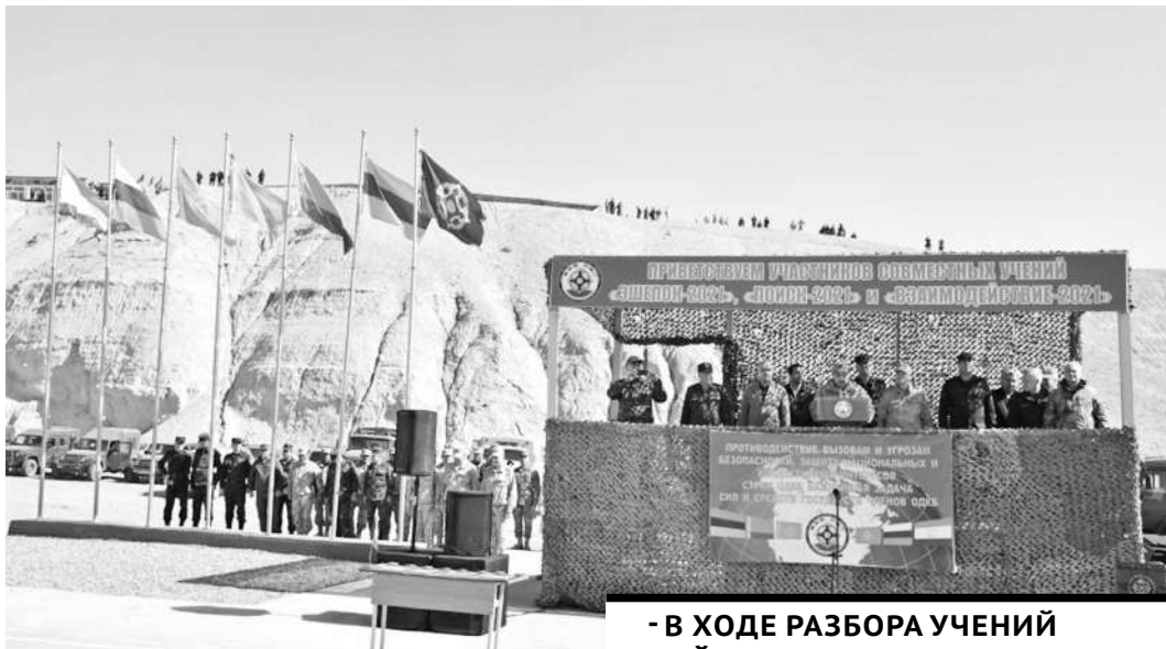
- В ХОДЕ РАЗБОРА УЧЕНИЙ ДЕЙСТВИЯМ КАЗАХСТАНСКИХ ОФИЦЕРОВ БЫЛА ДАНА ВЫСОКАЯ ОЦЕНКА.

Офицеры тылового обеспечения из различных регионов Казахстана, в том числе из Карагандинской области, приняли участие в специальной тренировке «Эшелон-2021», которая проходила на полигоне Харбмайдон в Таджикистане. Наши военнослужащие успешно выполнили поставленные задачи, которые заключались в разработке совместной операции по снабжению подразделений международной коалиции.