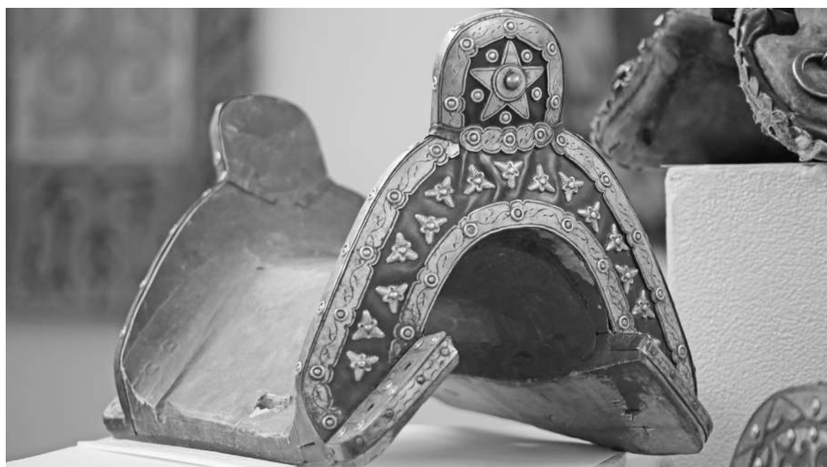
Фото Александра МАРЧЕНКО г. Темиртау

Каждый экспонат дает представление о том, как жили наши предки, из чего состоял быт кочевников. Все предметы в юрте имели особую функцию. Взять, к примеру, адалбакан - вешалку для одежды. Как правило, ее устанавливали в правой стороне юрты, которая считалась мужской. Этот предмет утвари наделялся большим смыслом, так как ассоциировался с прообразом мирового древа в трехмерном восприятии мира.