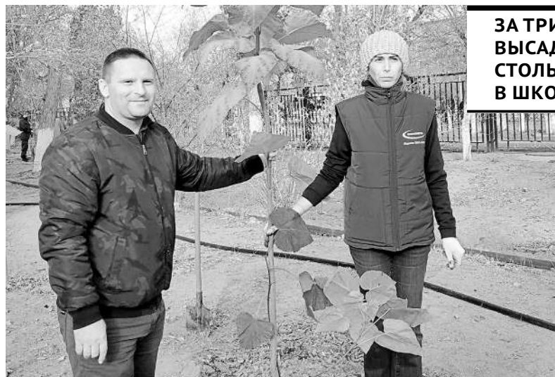
Фото автора г. Жезказган

Всего за три дня, с 21 по 23 октября, школьники, их родители и учителя высадили несколько сотен деревьев. Инициатором и организатором акции выступил отдел охраны окружающей среды корпорации «Казахмыс». «Зеленую» инициативу поддержал и Карагандинский экологический музей. Саженцы деревьев и кустарников выращены в Жезказганском центре детского и юношеского творчества (ЦДЮТО).