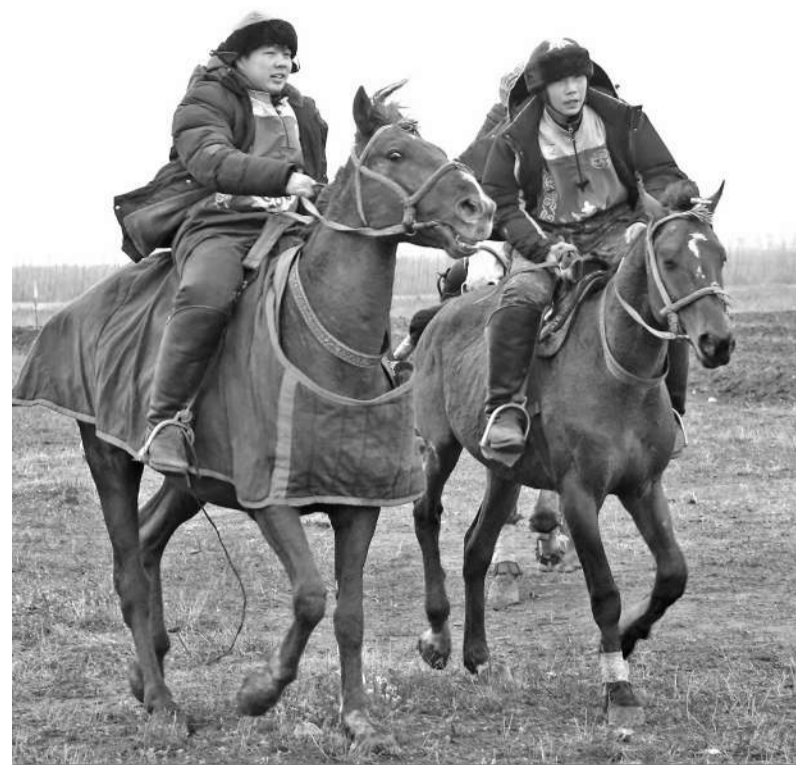
В РЕШАЮЩЕМ ПОЕДИНКЕ СПОРТСМЕНАМ ПРИШЛОСЬ НЕЛЕГКО. ПЕРЕД СТАРТАМИ ЛИЛ ДОЖДЬ, А ЗАТЕМ НАЛЕТЕЛ ХОЛОДНЫЙ ВЕТЕР.