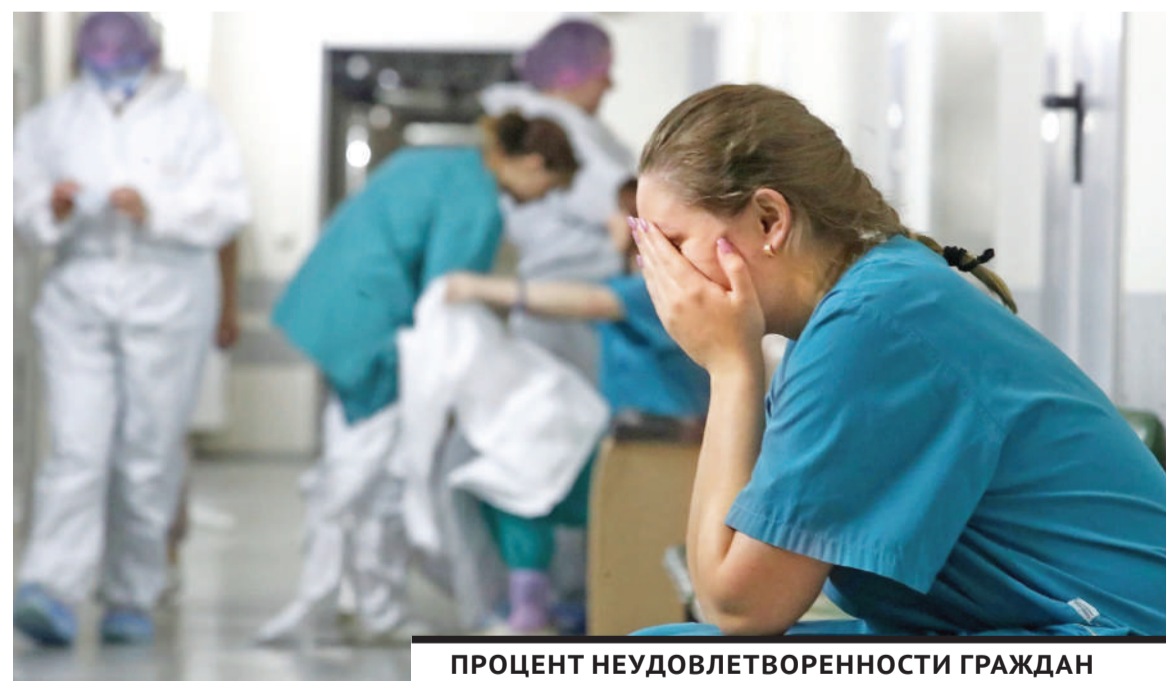
ПРОЦЕНТ НЕУДОВЛЕТВОРЕННОСТИ ГРАЖДАН ОКАЗАНИЕМ МЕДИЦИНСКОЙ ПОМОЩИ В ГОРОДСКИХ ПОЛИКЛИНИКАХ И СТАЦИОНАРАХ УВЕЛИЧИЛСЯ И СОСТАВЛЯЕТ 95% ОТ ОБЩЕГО ЧИСЛА ПРОВЕРЕННЫХ МЕДОРГАНИЗАЦИЙ, А В СЕЛЬСКИХ - ВСЕГО 5%.

В своем Послании народу Казахстана Президент Касым-Жомарт Токаев отвел особую роль повышению эффективности системы здравоохранения. Он отметил, что Казахстан с первых дней пандемии без промедления принял эффективные меры для борьбы с распространением инфекции. Большой акцент был сделан на реабилитации. А теперь нельзя допустить ухудшения ситуации с заболеваниями, не связанными с коронавирусом.