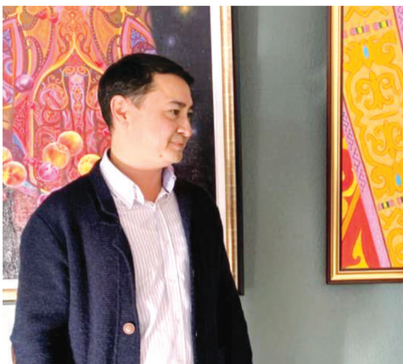
Карагандинский живописец получил широкую известность за рубежом.