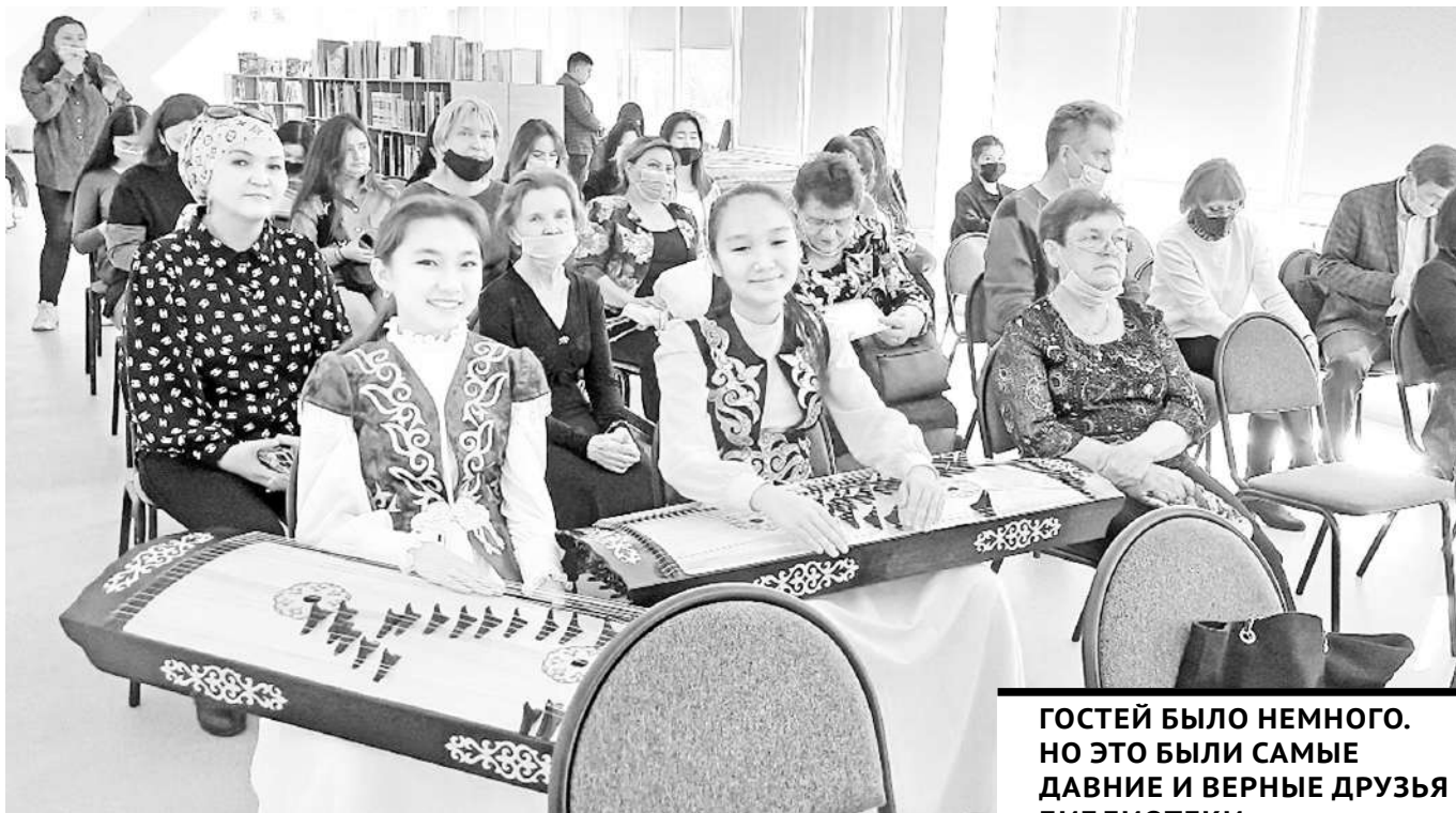
ГОСТЕЙ БЫЛО НЕМНОГО. НО ЭТО БЫЛИ САМЫЕ ДАВНИЕ И ВЕРНЫЕ ДРУЗЬЯ БИБЛИОТЕКИ.

Не одно поколение карагандинских художников, артистов и музыкантов, искусствоведов и преподавателей творческих дисциплин выросло на фундаменте отдела литературы по искусству областной универсальной научной библиотеки им. Н.В. Гоголя, который в этом году празднует 50-летний юбилей.