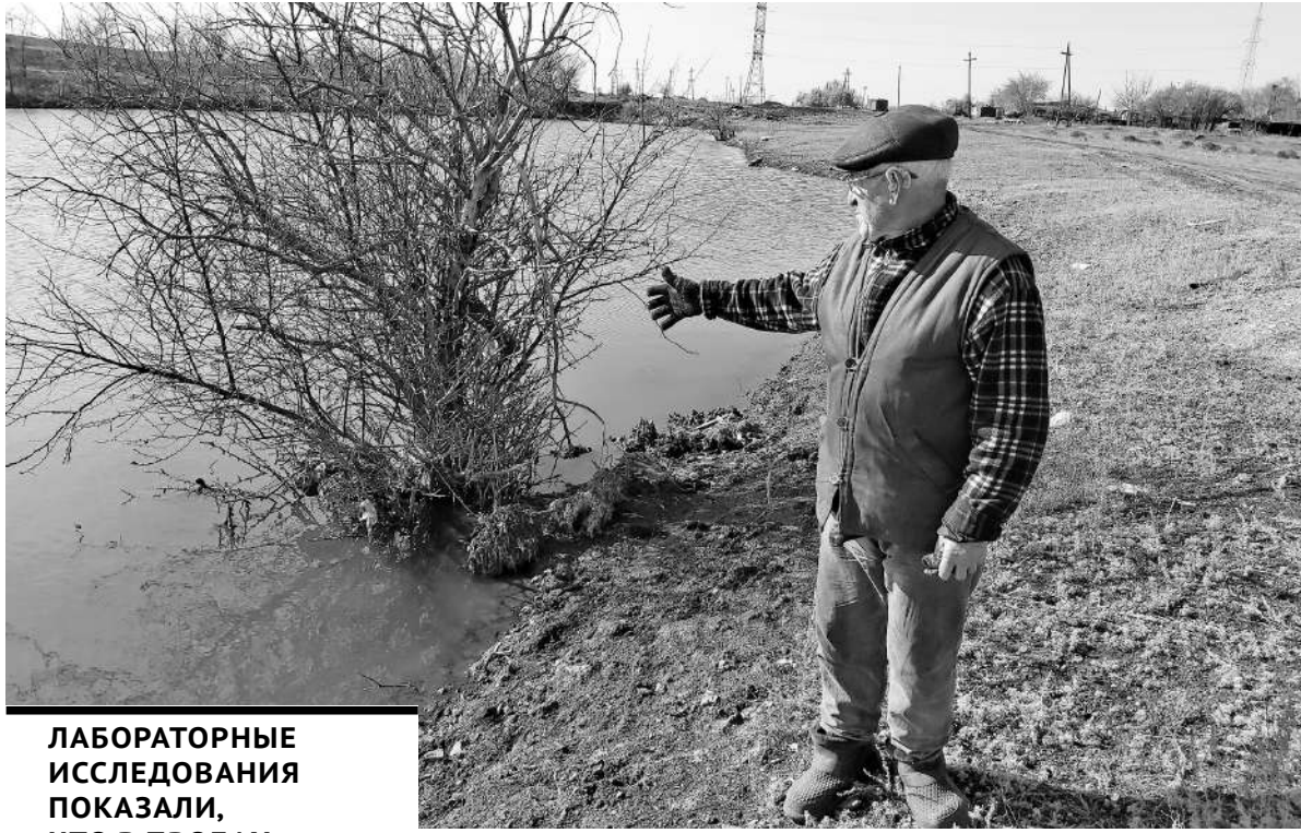
ЛАБОРАТОРНЫЕ ИССЛЕДОВАНИЯ ПОКАЗАЛИ, ЧТО В ПРОБАХ ИМЕЮТСЯ ОСТАТКИ НЕФТЕПРОДУКТОВ, ТЯЖЕЛЫХ МЕТАЛЛОВ.

- К сожалению, по истечении двух месяцев предприятие не приняло никаких действенных мер по устранению проблемы, - констатировал он. - Да, они прекратили сброс. Но не сделали так, как того требует законодательство, - полностью не устранили последствия. В