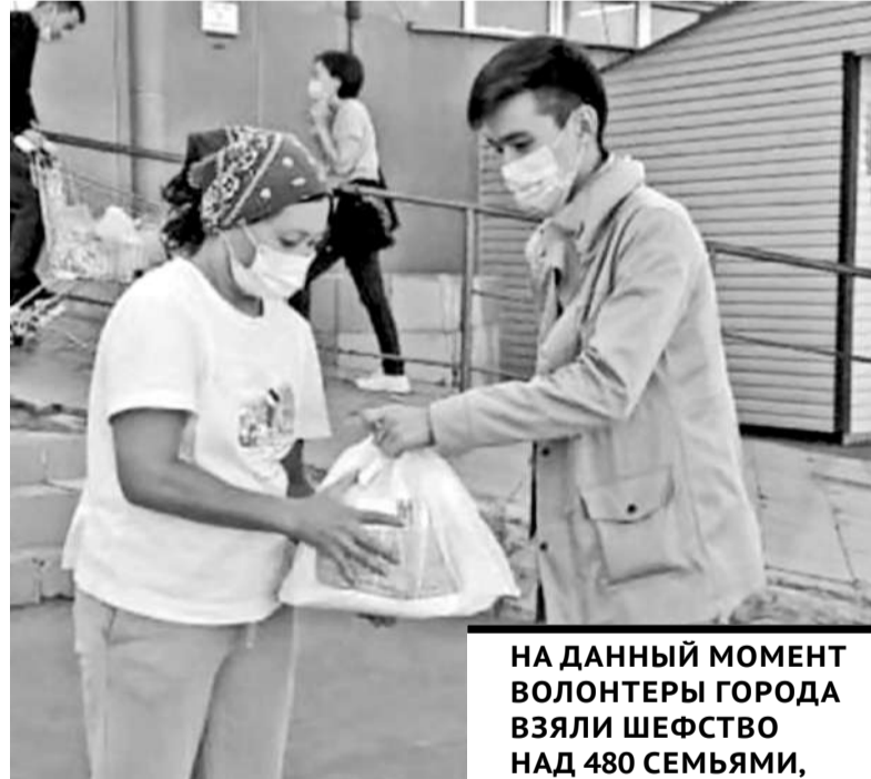
НА ДАННЫЙ МОМЕНТ ВОЛОНТЕРЫ ГОРОДА ВЗЯЛИ ШЕФСТВО НАД 480 СЕМЬЯМИ, КОТОРЫМ ПОСТОЯННО ОКАЗЫВАЕТСЯ ПОМОЩЬ.

Есть люди, которые получают единоразовную помощь. Но чаще неравнодушные молодые люди при-