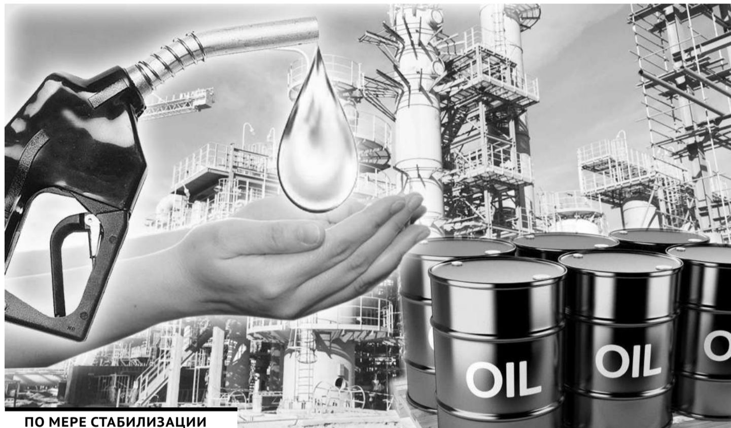
ПО МЕРЕ СТАБИЛИЗАЦИИ СИТУАЦИИ С ПОСТАВКАМИ ПОЛОЖЕНИЕ С ЦЕНАМИ ТАКЖЕ БУДЕТ СТАБИЛИЗИРОВАТЬСЯ.

Это даст еще порядка 29 тыс. тонн выработки дизтоплива. Для того чтобы в начале месяца пополнить запасы дизельного топлива, мы перенесли также ремонт первичного комплекса переработки на Павлодарском нефтехимическом заводе на 9 дней, что также дает около 30 000 тонн выработки топлива в первой декаде октября. По поручению Премьер-министра провели переговоры с Российской Федерацией. Мы видим, что идет активизация отгрузок дизельного топлива с НПЗ РФ. Если с 1 по 20 сентября отгрузки с заводов составляли порядка 5,5 тыс. тонн, уже с 21 по 30 сентября - 38 тыс. тонн, с 1 по 10 октября - 22 тыс. тонн. Через таможенную статистику мы видим, что подтверждают эти отгрузки. Импорт в сентябре составил 17 тысяч тонн, а за 8 дней 32 тыс. тонн дизельного топлива прошло через границу. С учетом принятых мер, а также учитывая, что