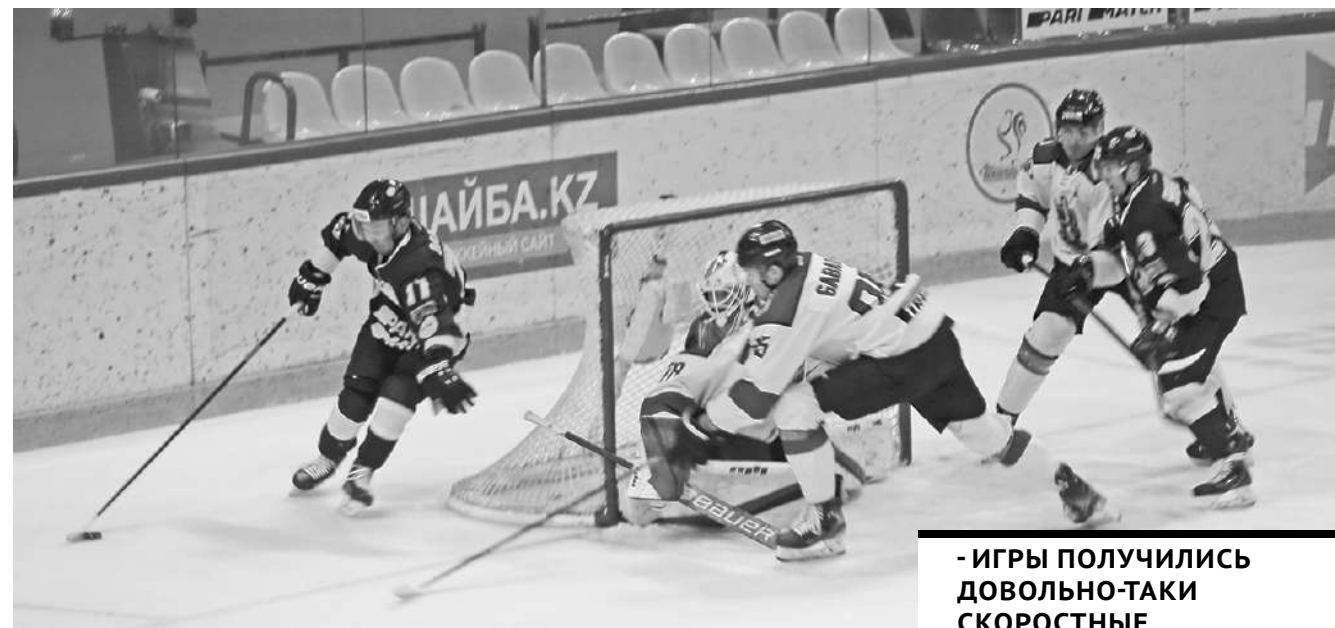
- ИГРЫ ПОЛУЧИЛИСЬ ДОВОЛЬНО-ТАКИ СКОРОСТНЫМИ, С МНОЖЕСТВОМ ОПАСНЫХ МОМЕНТОВ.

6 и 7 октября на льду «Караганда-Арены» состоялись очередные домашние матчи хоккейного клуба «Сарыарка» в рамках чемпионата Казахстана Pro Hockey Ligy. В гости к «орлам» приехали спортсмены из Атырау.