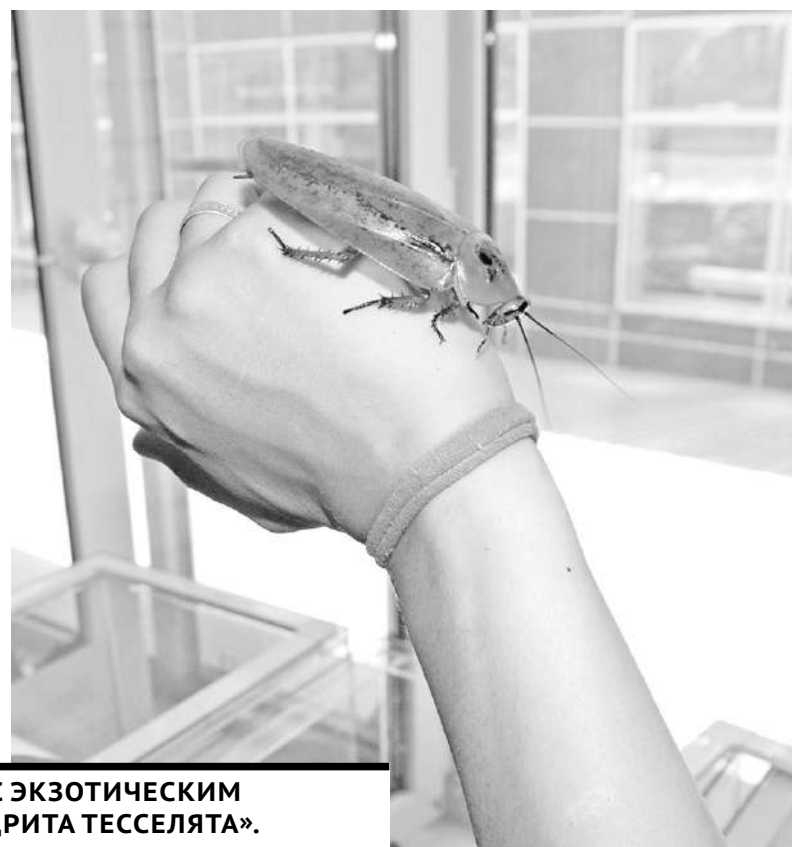
г. Темиртау