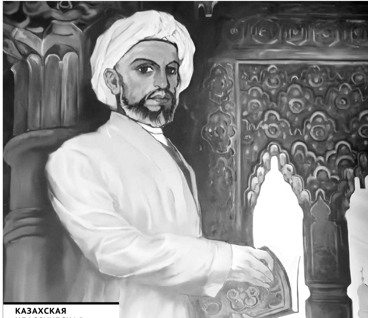
КАЗАХСКАЯ КЛАССИЧЕСКАЯ ПОЭЗИЯ БЕРЕТ СВОЕ ИЗДРОЖНОЕ НАЧАЛО ИЗ ДУХОВНОГО, ЭСТЕТИЧЕСКОГО МИРА «БЛАГОДАТНОГО ЗНАНИЯ» ЮСУФА БАЛАСАГУНИ.

5. Все-таки наиболее удачно выражает основную идею произведения перевод заглавия поэмы, сделанный С.Н. Ивановым, автором первого русского поэтического перевода «Кутадгу билиг», - «Благодатное знание».