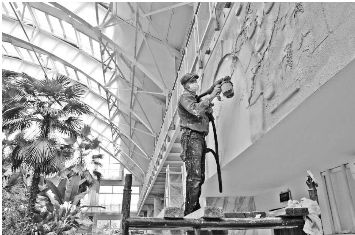
Фото Александра МАРЧЕНКО г. Темиртау