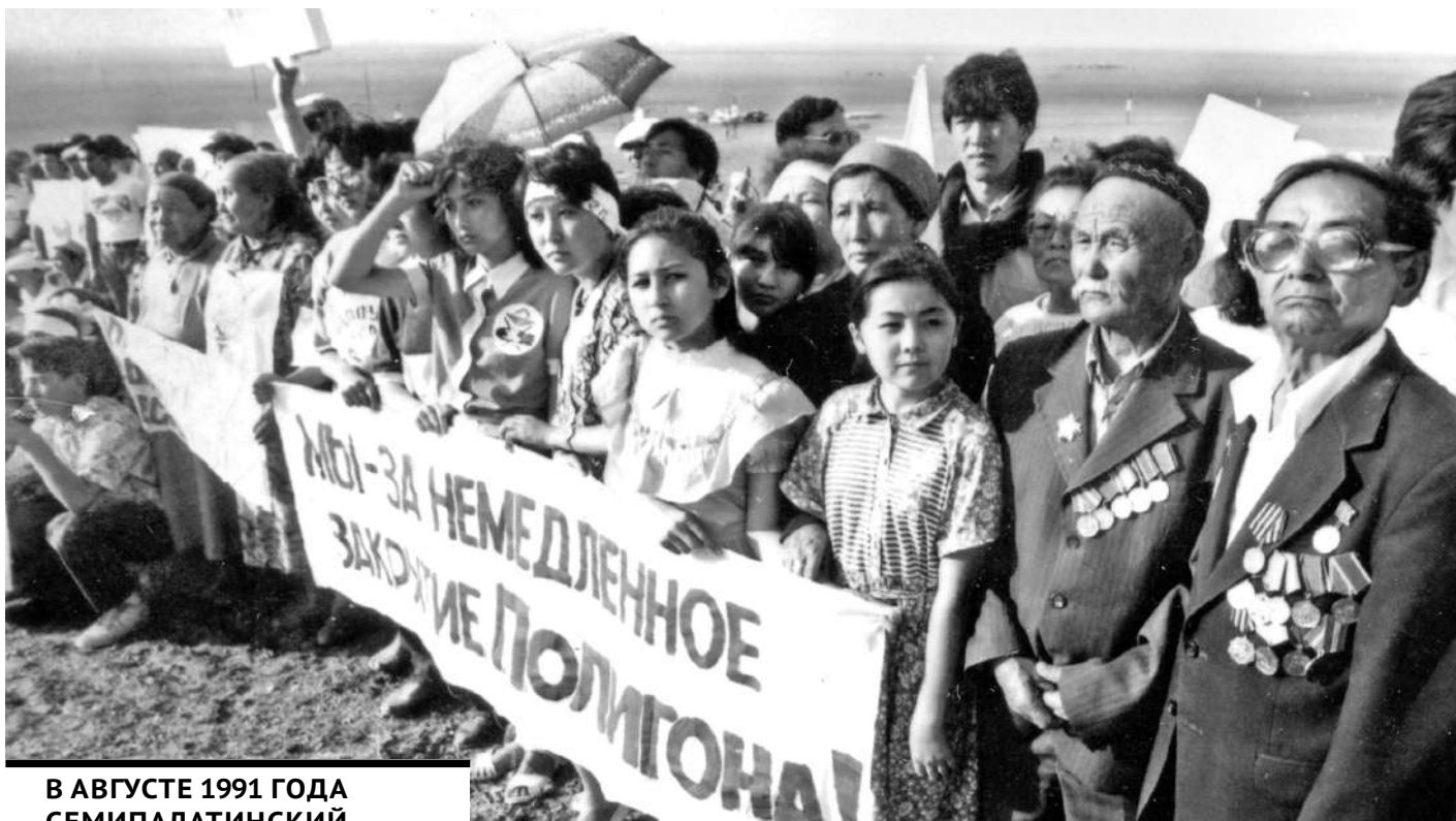
В АВГУСТЕ 1991 ГОДА СЕМИПАЛАТИНСКИЙ ПОЛИГОН БЫЛ ОФИЦИАЛЬНО ЗАКРЫТ.

В феврале 1989 года я узнал, что после каждого подземного взрыва происходил большой выброс радиоактивного газа. Я сразу написал об этом. Письмо с сообщением о подземном испытании с выбросом радиоактивного газа и просьбой о прекращении испытаний подписали депутаты Верховного Совета Казахской ССР и послали его в Президиум Верховного Совета СССР.