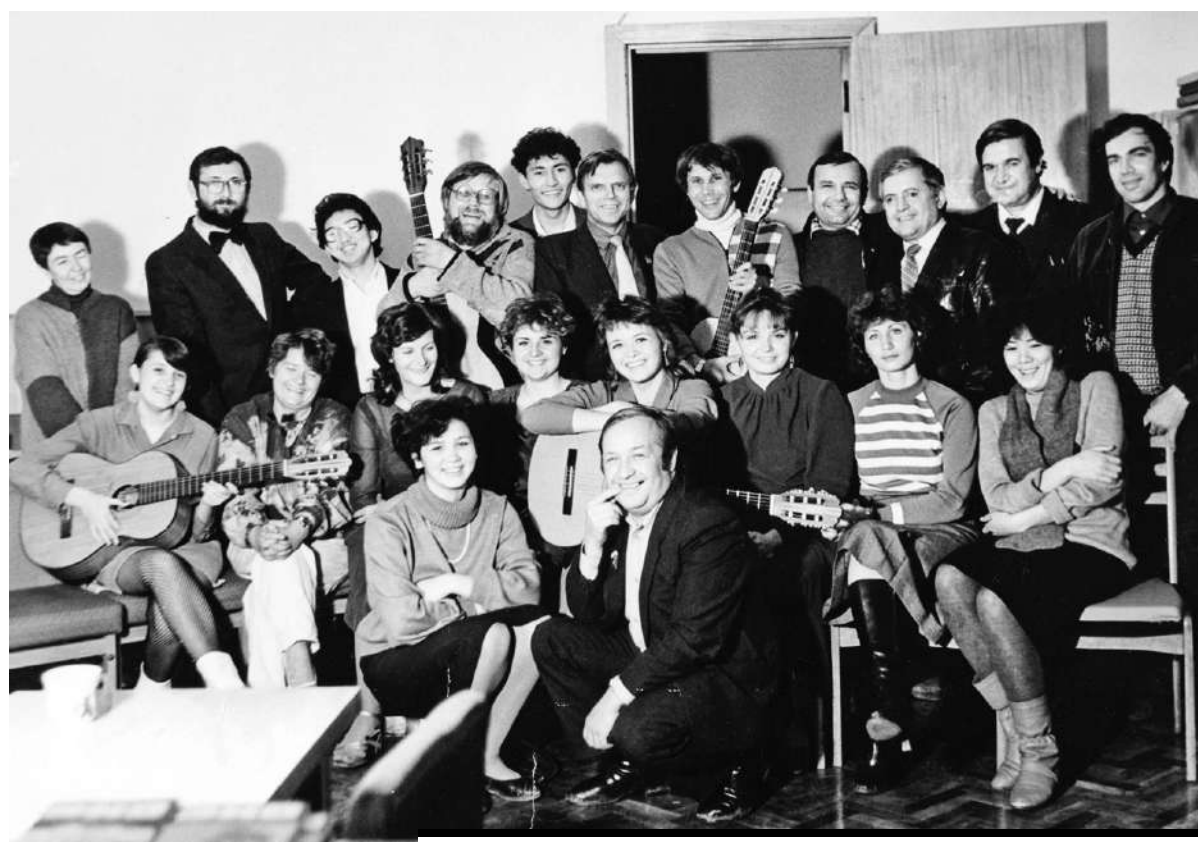
ГОСТЯ У РЕДАКЦИИ ГАЗЕТЫ КЛУБ АВТОРСКОЙ ПЕСНИ «МАРИАННА».

Не думал, что дружба и сотрудничество с «Индустриалкой» продолжится на долгие годы.