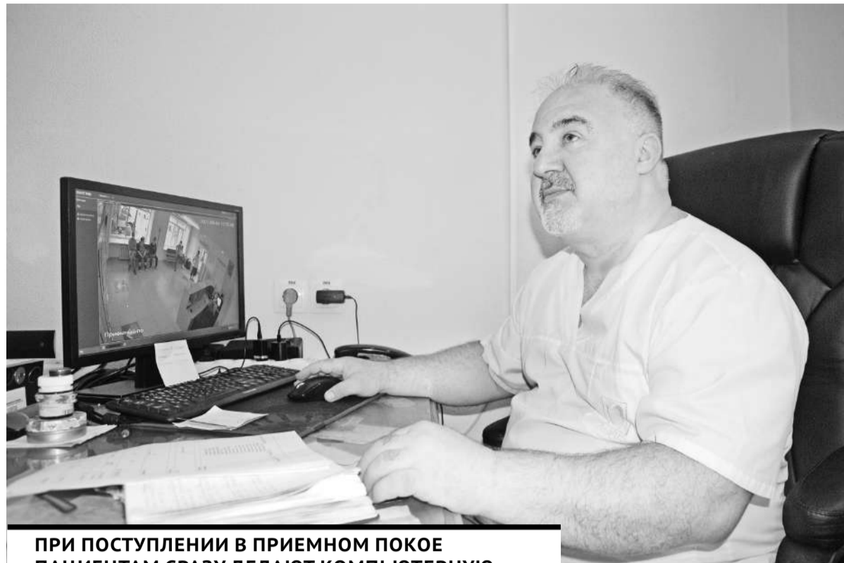
ПРИ ПОСТУПЛЕНИИ В ПРИЕМНОМ ПОКОЕ ПАЦИЕНТАМ СРАЗУ ДЕЛАЮТ КОМПЬЮТЕРНУЮ ТОМОГРАФИЮ, ПОСЛЕ ЧЕГО ПО ЕЕ РЕЗУЛЬТАТАМ ПРОВОДЯТ СОРТИРОВКУ: ТЯЖЕЛЫХ ОСТАВЛЯЮТ ЗДЕСЬ, А ТЕХ, У КОГО ПОРАЖЕНИЕ ЛЕГКИХ МЕНЕЕ 20%, ОТПРАВЛЯЮТ В ДРУГИЕ КЛИНИКИ.

Я обращаюсь ко всем землякам: пожалуйста, вакцинируйтесь! Те, кто сделал прививку, переносят болезнь намного легче. Моя дочь