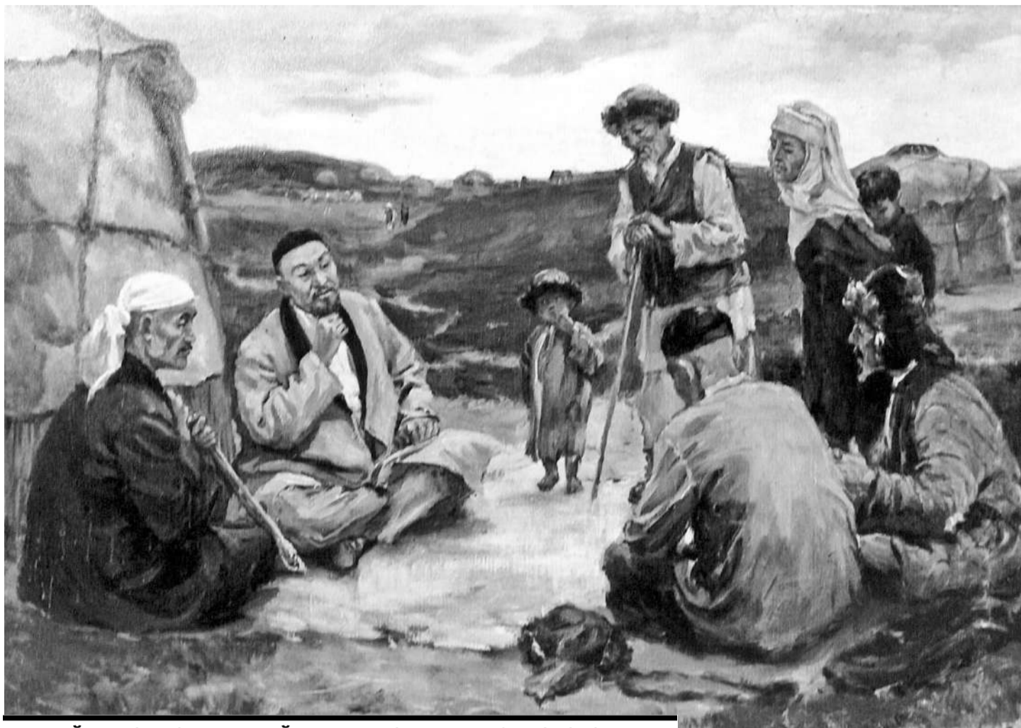
АБАЙ ВНЕС НЕОЦЕНИМЫЙ ВКЛАД В СУДЬБУ КАЗАХСКОГО НАРОДА, ПРИЗЫВАЯ СОТЕЧЕСТВЕННИКОВ К ДОБРОДЕТЕЛИ, ТРУДУ И ЗНАНИЯМ, ПАТРИОТИЗМУ И ДУХОВНОСТИ.

Отмечая день рождения Абая, потомки великого мыслителя тем самым выражают свое уважение уникальной личности, оставившей неизгладимый след в истории нации, ее трудам и наследию. Абай внес неоценимый вклад в судьбу казахского народа, призывая соотечественников к добродетели, труду и знаниям, патриотизму и духовности. Как отметил Елбасы Нурсултан Назарбаев в своей статье «Духовное завещание Абая»: «Фигура Абая Кунанбаева - явление такого же знакового по своему смыслу периода смены веков и «золотой мост», соединяющий прошлое с будущим. Великий поэт, гениальный