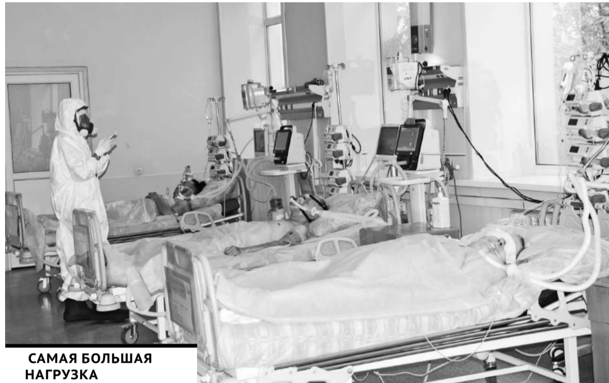
САМАЯ БОЛЬШАЯ НАГРУЗКА ЛОЖИТСЯ НА ПЛЕЧИ РЕАНИМАТОЛогов - ОНИ КРУГЛОСУТОЧНО НАХОДЯТСЯ РЯДОМ С БОЛЬНЫМИ.

Оснащенность всех инфекционных стационаров стопроцентная, имеются лекарства, изделия медназначения и средства индивидуальной защиты, запасов хватит на 3-4 месяца работы, и их постоянно пополняют.