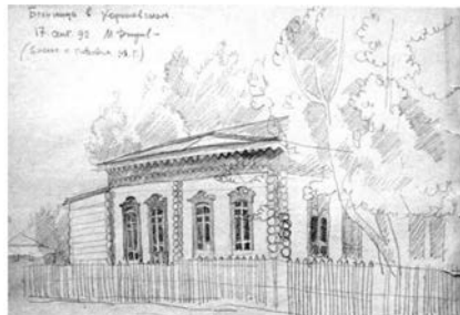
Больница в Бельгааше