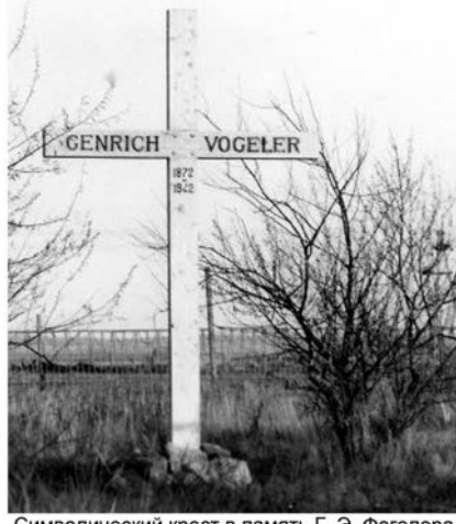
Символический крест в память Г. Э. Фогелера