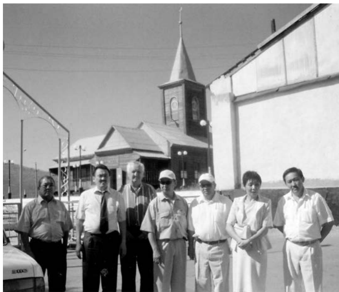
Преподаватели КарГУ у Карагандинской мечети. Лето 2005 года.

Местное мусульманское общество результатами осмотра сильно сконфужено.»