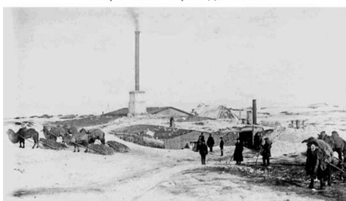
Успенский рудник зимой.

со своего «поручения» на третий день, и я отдам ему четыре рубля, которые включают и лошадей, и расходы; он вполне счастлив, но деньги должны быть переданы в тот же момент или он сразу теряет достоинство, становится ворчливым, капризным и начинает спорить писклявым голосом. Однажды я сделал вид, что не понимаю его желания получить деньги сейчас же, улыбаясь ему. Он ушел очень обеспокоенным и скоро вернулся со всеми своими друзьями, галдящими одновременно. Наконец меня озарило, и они радостно ушли, привозя «Ой бай! Коп акша, коп!» (О,