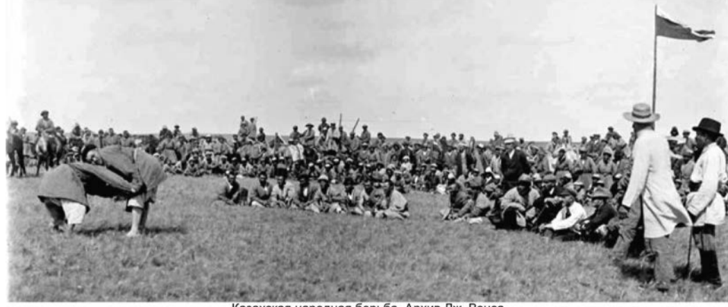
Казакская народная борьба.

Ни один киргиз не пойдет сотню ардов пешком, если он может проехать верхом. Его большие киргизские ботфорты не созданы для ходьбы из-за большого каблука, как у западного ковбоя, для предотвращения проскальзывания